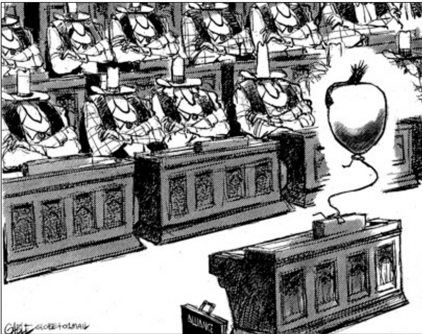
Brian Gable, dans le Globe and Mail , 28 février 2001