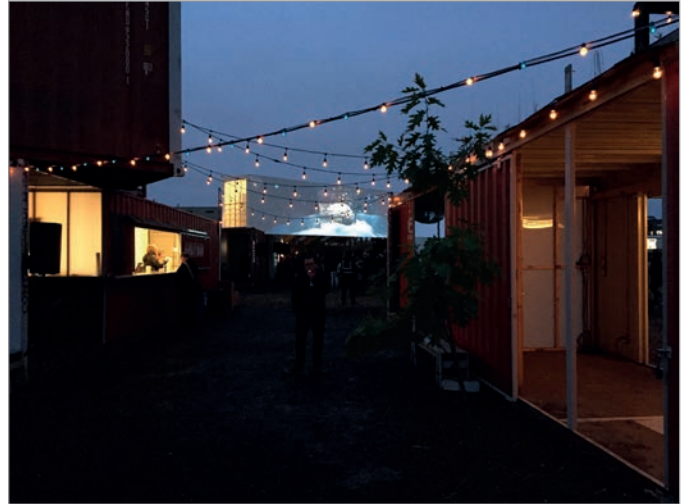
ILL. 32. LE VIRAGE LA NUIT AVEC UNE PROJECTION DE « MOMENT FACTORY », UN STUDIO MULTIMÉDIA SPÉCIALISÉ DANS LA CONCEPTION ET LA PRODUCTION D'ENVIRONNEMENTS IMMERSIFS. | JONATHAN CHA.

« mettent la participation citoyenne au cœur de la démarche en donnant la possibilité d'acquérir des outils pour devenir un acteur de changement et permettent d'aborder la question environnementale d'une façon éducative 79 ». Le lieu est abordable et adaptable. Comme l'écrit dans le Chicago Reader Maya Dukmasora 80 , qui considère les jardins communautaires comme transformateurs de la société urbaine, les villes doivent adopter une posture de spontanéité et offrir des espaces pour s'exprimer, expérimenter, tester, conceptualiser. L'évolution de ces nouvelles pratiques agiles et citoyennes 81 permet d'influencer la manière de façonner l'espace public et de répondre au « désir de ville ». L'adaptation, l'agilité, la flexibilité et l'informalité constituent des ingrédients importants des formes émergentes d'espaces publics.