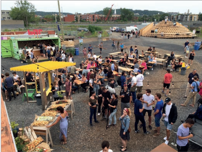
ILL. 31. UN ÉVÈNEMENT GASTRONOMIQUE AU VIRAGE; À L'ARRIÈRE-PLAN, UNE VUE SUR L'INSTALLATION DU « MONT RÉEL ». | JONATHAN CHA.