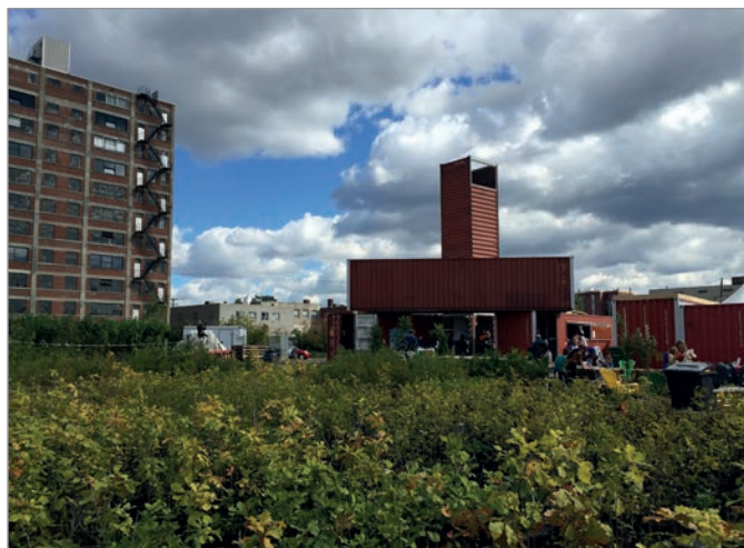
ILL. 20. LES JARDINS ÉPHÉMÈRES ENTOURANT LE VIRAGE. | JONATHAN CHA.

réalité et une attente grandissantes pour la population. Le prototypage du Virage et des projets éphémères dépasse les limites de la pratique urbanistique habituelle. Il offre à l'Université de Montréal et à la Ville de Montréal la possibilité « d'intervenir entre les réalités et les potentialités », la flexibilité dans la planification et l'élaboration des politiques, tout en gardant les choses ouvertes, tandis que des solutions provisoires sont anticipées, développées ou rejetées 49 .