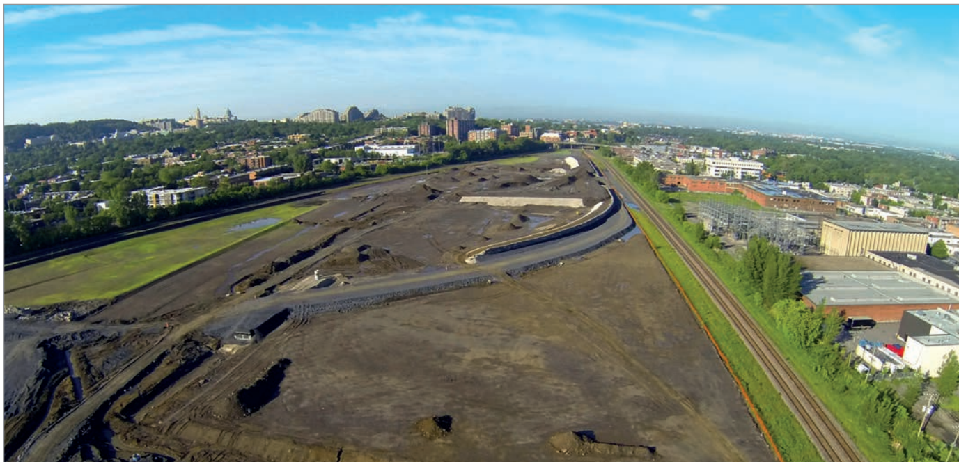
ILL. 2. LE NIVELLEMENT DE L'ANCIENNE COUR DE TRIAGE DU CANADIEN PACIFIQUE ET LE REPOSITIONNEMENT DES VOIES FERRÉES. | CAMPUS MIL, UNIVERSITÉ DE MONTRÉAL.