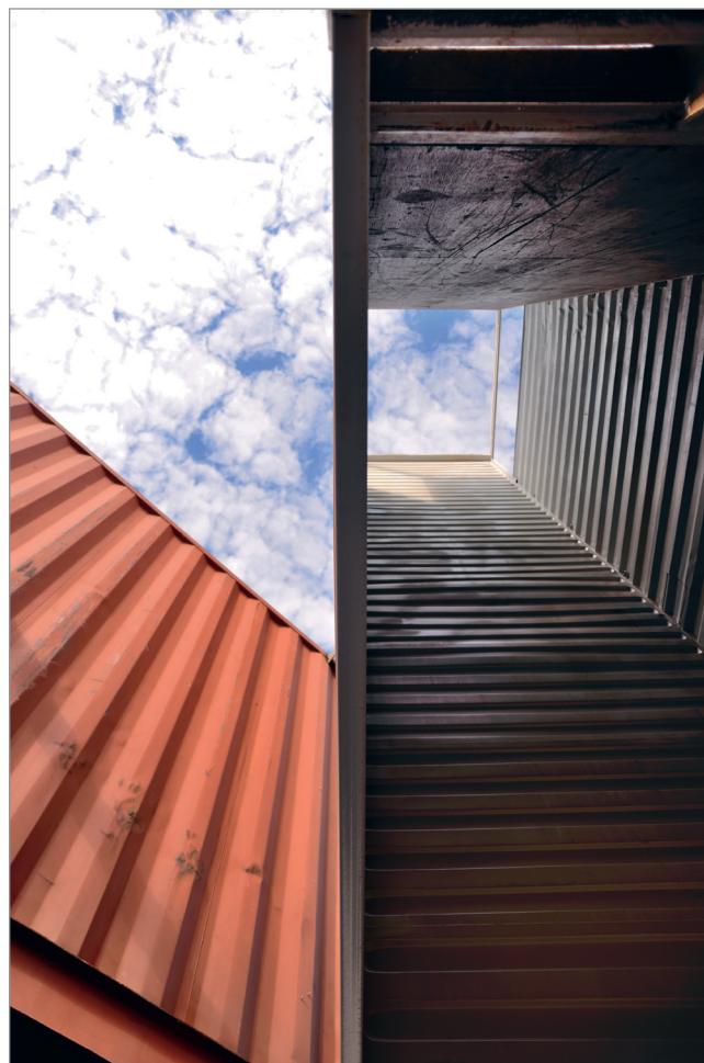
ILL. 12. LE PHARE DU VIRAGE, ÉLÉMENT D'ARCHITECTURE VERTICALE QUI DIALOGUE AVEC LA TOUR DE L'UNIVERSITÉ DE MONTRÉAL. | MARYLÈNE PERRAS.

San Francisco, le prototypage urbain est un mouvement mondial qui explore comment le design participatif peut améliorer les villes 39 . Selon la firme Gehl Architects,