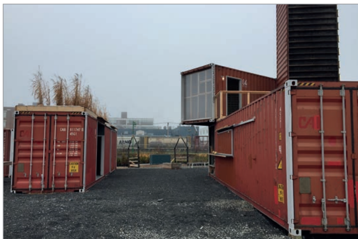
ILL. 11. LE CŒUR DE L'ASSEMBLAGE D'ESPACES ET DE VOLUMES DU VIRAGE ET LES TRAINS DE MARCHANDISES EN MOUVEMENT. | MARYLÈNE PERRAS.