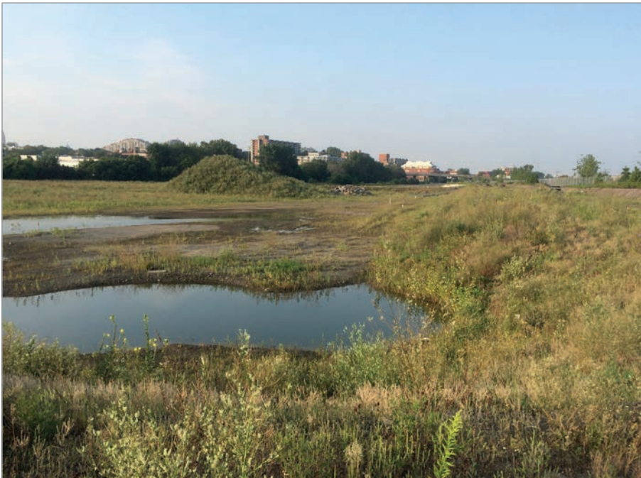
ILL. 1. LA FRICHE DE L'ANCIENNE COUR DE TRIAGE DU CANADIEN PACIFIQUE AVANT LE DÉBUT DU PROJET.

Le Virage est le nom d'un espace extérieur formé d'un assemblage de conteneurs recyclés entouré de jardins potagers (projets éphémères) implanté pour une durée limitée (5 ans) et destiné à recevoir des activités éducatives, publiques et