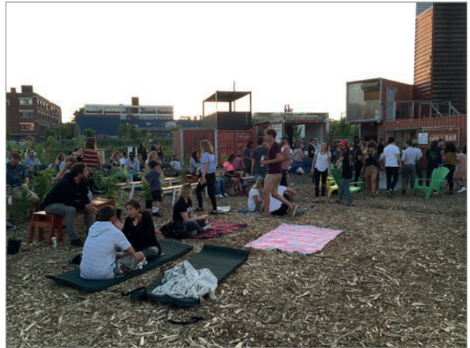
ILL. 26. OCCUPATION CITOYENNE LORS D'UNE SOIRÉE D'ÉTÉ AU VIRAGE. | JONATHAN CHA.

institutionnel initial derrière ce jardin collectif en est un d'acceptabilité sociale liée aux nuisances du chantier, à l'arrivée de milliers de personnes et aux effets possibles d'embourgeoisement du quartier Parc-Extension. Ces intentions institutionnelles n'ont pas empêché les acteurs et les organismes impliqués dans la création des jardins de mettre de l'avant une pensée orientée vers les systèmes naturels, l'écologie, la biophilie et le biomimétisme.