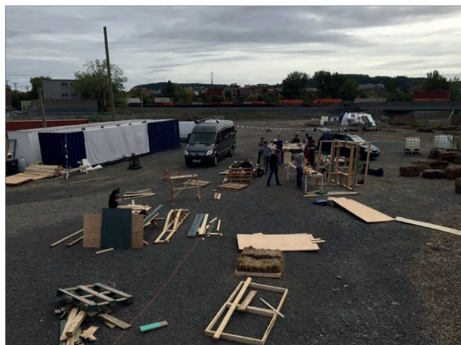
ILL. 4. ATELIER DE COCONSTRUCTION AVEC LES ÉTUDIANTS. | JONATHAN CHA.

culturelles. Il est situé à l'angle des avenues Atlantic et Durocher au cœur de l'île de Montréal, sur le site du futur campus MIL de l'Université de Montréal.