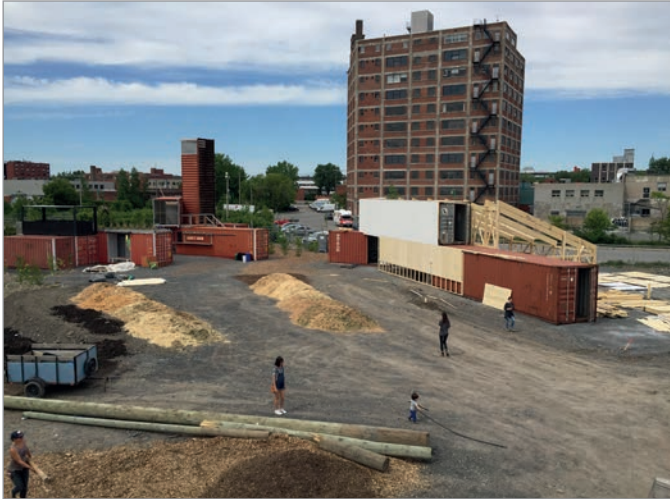
ILL. 23. LE GRAND HALL DU VIRAGE EN CONSTRUCTION ET L'ÉVOLUTION DES SURFACES AU SOL. | JONATHAN CHA.