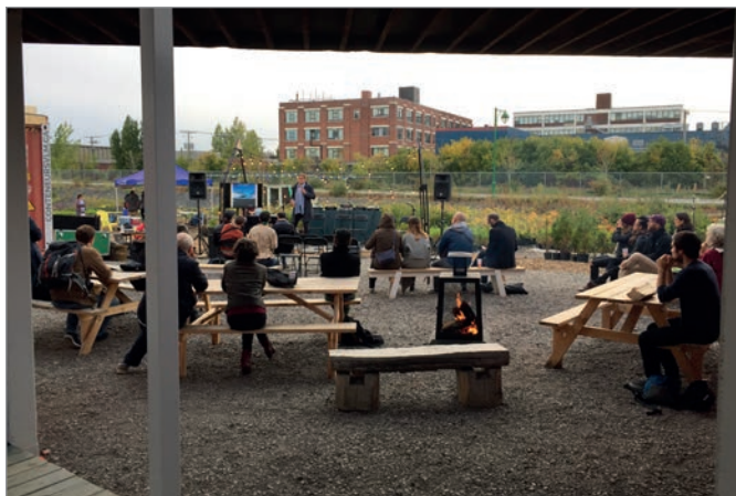
ILL. 18. UNE CONFÉRENCE EXTÉRIEURE DANS L'AGORA AU VIRAGE VUE DEPUIS LE PASSAGE COUVERT.