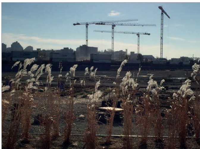
ILL. 3. LE SITE DES PROJETS ÉPHÉMÈRES, 2016. | MARYLÈNE PERRAS.