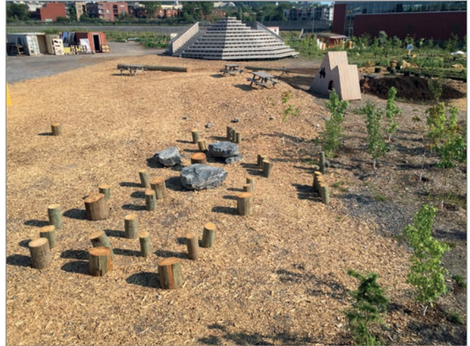
ILL. 28. DES INSTALLATIONS FLEXIBLES SUR L'ESPLANADE DU VIRAGE À PARTIR DE MATÉRIAUX RÉCUPÉRÉS. | JONATHAN CHA.

partagée des organismes de créer un écosystème humain et écologique signe de changement dans la société.