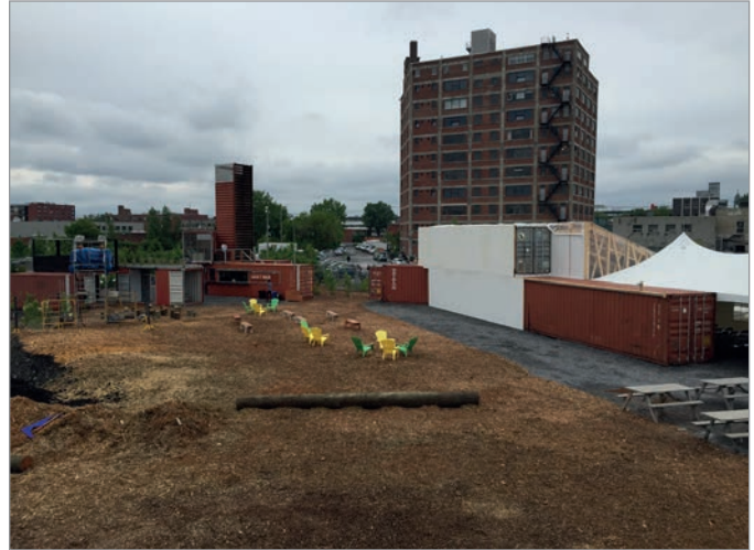
ILL. 24. L'ESPLANADE ET LE GRAND HALL DU VIRAGE. | JONATHAN CHA.

de la Faculté de l'aménagement de l'Université de Montréal (architecture, architecture de paysage, design d'intérieur, design industriel, urbanisme). Dans des concours prenant la forme de workshops, des professeurs, des chargés de cours et des professionnels ont supervisé, jugé et sélectionné les propositions les plus originales et réalistes. Les étudiants ont par la suite été encadrés (sous forme de stages) par MVM et des bureaux professionnels et ont participé au processus de coconstruction du lieu en usine et in situ , en collaboration avec de jeunes diplômés et des entrepreneurs 54 . Ce type d'approche très structurée misant sur la multidisciplinarité et la formation n'est pas sans heurts (difficulté à trouver des étudiants motivés et disponibles, beaucoup de temps d'encadrement et de logistique, manque d'expérience des intervenants, difficulté d'avoir des professionnels expérimentés en raison des faibles ressources financières, collaboration nécessaire entre les acteurs, temps limité), mais a l'intérêt de passer rapidement de l'idée à la réalisation, de favoriser l'expérimentation et de forcer « les designers à vivre et à observer intensément le site du projet 55 ».