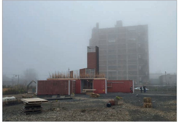
ILL. 10. L'AMBIANCE DE PAYSAGE INDUSTRIEL DU SITE DES PROJETS ÉPHÉMÈRES, DU VIRAGE ET DE L'ÉDIFICE DU 400, AVENUE ATLANTIC. | MARYLÈNE PERRAS.

de Smet définit trois groupes d'acteurs et d'objectifs menant à la réalisation d'espaces temporaires : l'opportunisme (qui profite d'une situation spécifique), l'activisme (qui milite pour une cause en adoptant une attitude critique) et l'auto-organisation (qui porte l'idéologie de produire une ville meilleure par une approche bottom up ). Le Virage 31 répond particulièrement aux premier et troisième groupes et pourrait être « un exemple d'urbanisme temporaire qualifié d'assemblages précaires d'expressions matérielles et identitaires 32 ». Le Virage n'est ni militant ni revendicateur, mais s'inscrit néanmoins dans la remise en cause de l'urbanisme néolibéral 33 . Approuvé d'entrée de jeu par des institutions publiques, il est né de l'opportunité d'investir une parcelle de terrain appartenant à l'Université de Montréal sur son futur campus MIL et d'un financement obtenu de la Ville de Montréal en vertu du Plan de développement urbain, économique et social (PDUES) des secteurs Marconi-Alexandra, Atlantic, Beaumont et De Castelnau. C'est ainsi qu'un terrain expérimental contrôlé et un financement ont été obtenus 34 . La démarche a été initiée et réalisée conjointement entre