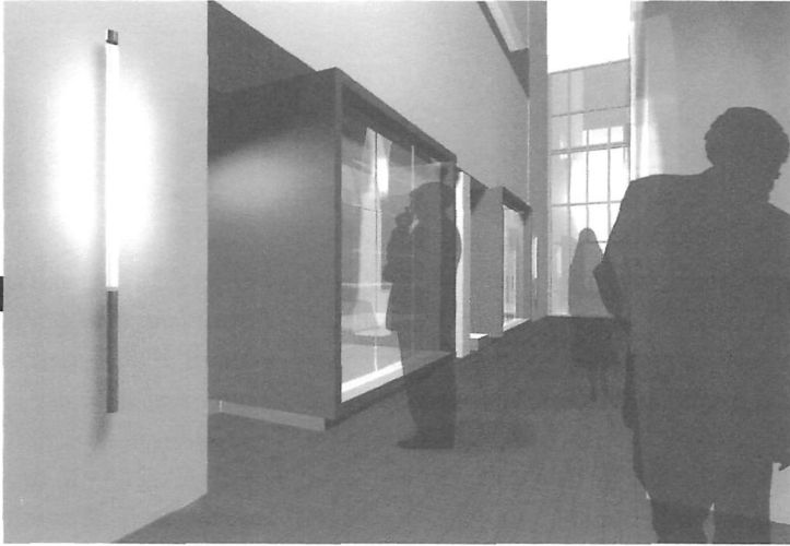
© CAROLINE LAJOIE | ARCHITECTE, BISSON ASSOCIÉS

dans un but précis, pour une commande spécifique. Le LAMIC est un lieu où les musées et les firmes peuvent se rencontrer sur une base autre que celle d'une relation d'affaires; voilà qui devrait intéresser un ensemble de joueurs du secteur. Globalement, ce laboratoire est aussi pensé pour les étudiants, par les étudiants, puisqu'en grande partie ce travail en est un d'équipe et que les étudiants ont effectivement joué un rôle très important dans la définition même du laboratoire.