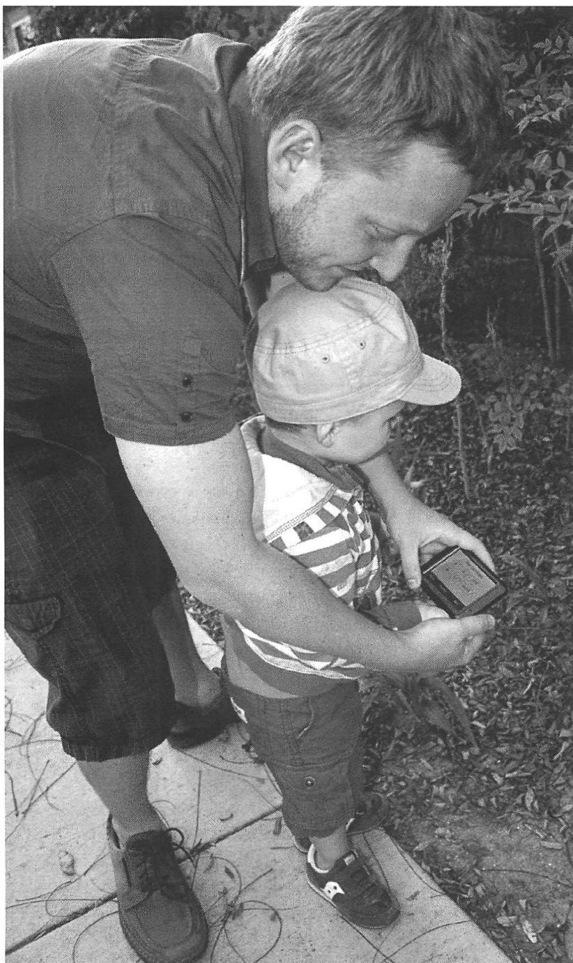
Vue de geocachers à l'œuvre Photo : Marie-Eve Champagne, 2011.