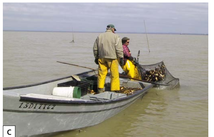
Figure 2. Illustrations des types d'engins de pêche utilisés par les pêcheurs commerciaux participant au Réseau de détection des espèces aquatiques exotiques envahissantes dans le fleuve Saint-Laurent : A) trappes fixes à anguille; B) filets maillants; C) verveux.

procédure à suivre lorsqu'ils capturent une espèce exotique. Un permis de gestion à des fins scientifiques leur est émis par le MRNF chaque année leur donnant l'autorisation de conserver les espèces exotiques. Le MRNF fournit à chaque pêcheur le matériel nécessaire à la conservation des spécimens comme les sacs de plastique et les étiquettes. Le personnel chargé du réseau de détection effectue des visites régulières afin de valider les observations des pêcheurs et de s'assurer de leur collaboration.