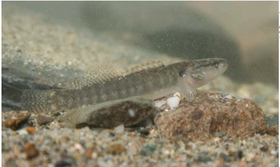
Figure 7. Dard barré.