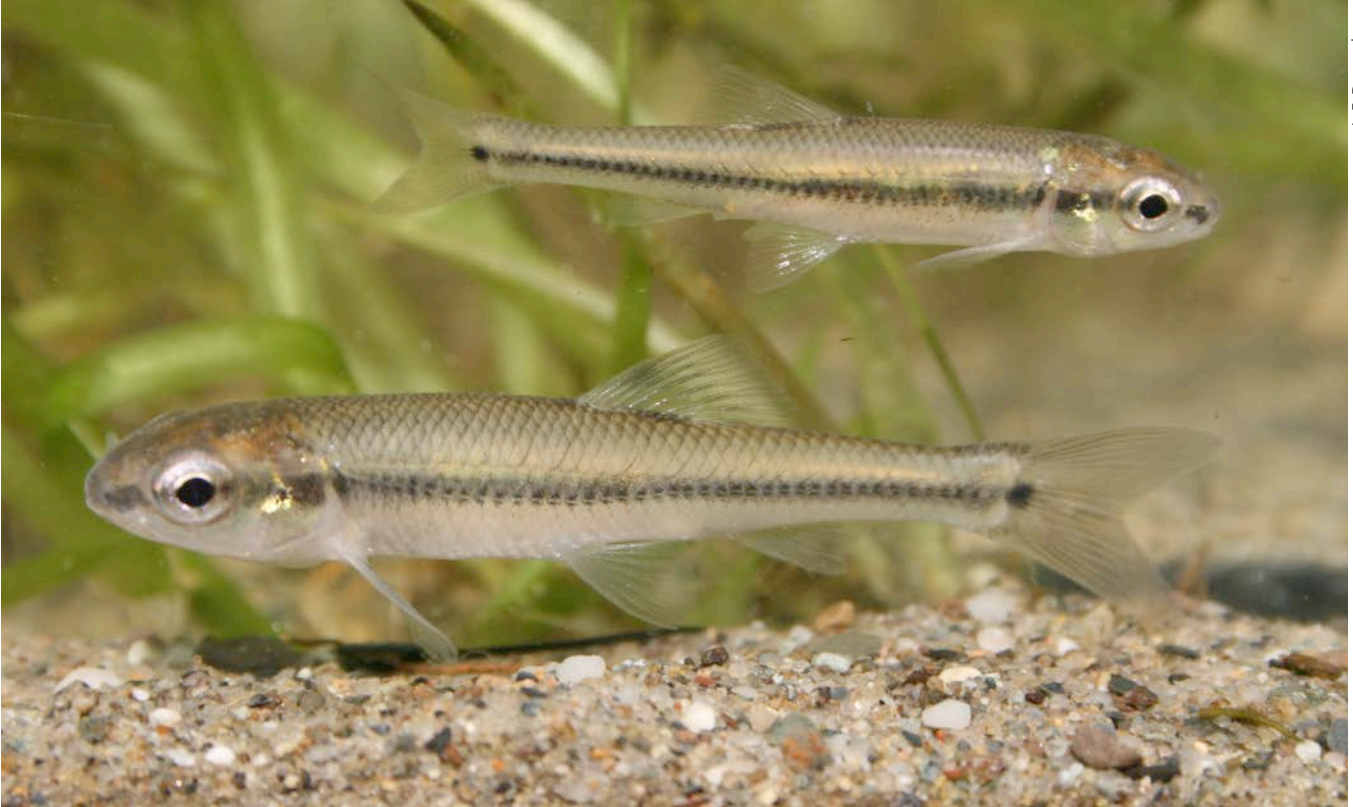
Figure 4. Jeunes ménés à museau arrondi.