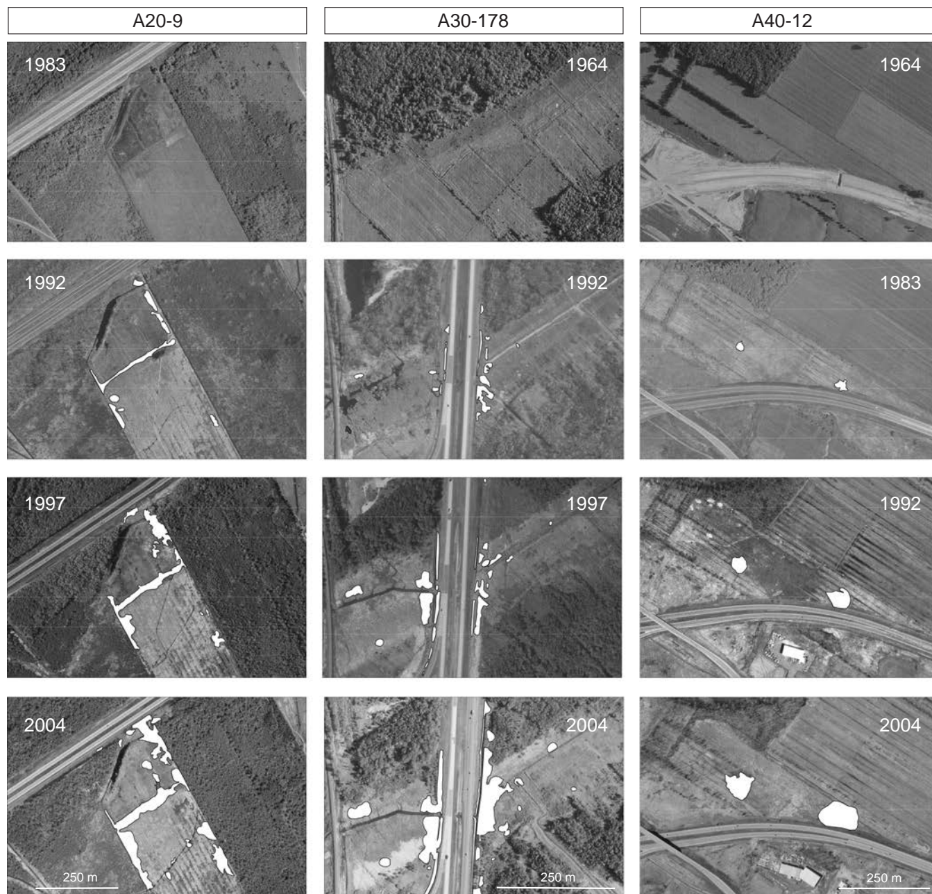
Figure 3. Reconstitution historique de l’envahissement par le roseau commun (polygones blancs) de trois marais (A20-9, A30-178, A40-12) situés à proximité d’autoroutes du sud du Québec. La reconstitution a été effectuée à l’aide de photographies aériennes numériques de haute résolution. L’année de la photographie est indiquée dans chaque cas.

roseau de continuer à croître en conditions de stress hydrique (Pagter et collab., 2005). En conditions sèches, l’envahissement se ferait principalement au moyen de stolons qui peuvent atteindre fréquemment des longueurs de plus de 5 m (B. Lelong, observations personnelles). Au contraire, un niveau d’eau élevé (supérieur à 1 m au-dessus de la surface du sol) freinera la progression du roseau et réduira ainsi les risques d’invasion du milieu humide (Hudon et collab., 2005).