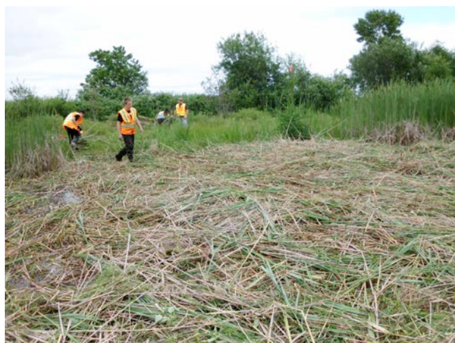
Coupe des tiges et transport à un lieu d'enfouissement sécuritaire.