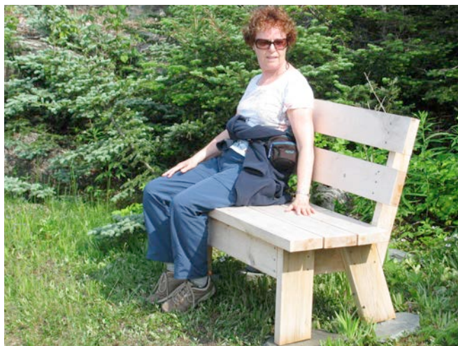
Banc installé à l'anse à la Canistre, île aux Basques.