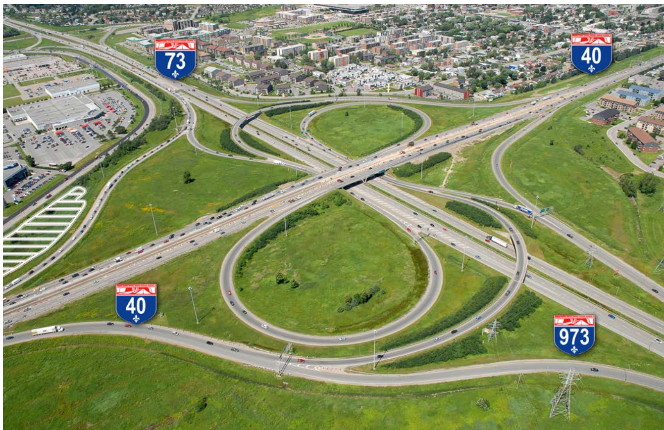
Figure 1. État des lieux de l'échangeur des autoroutes 40 et 73 situé dans la ville de Québec avant le réaménagement débuté en 2014. Malgré sa grande superficie, le site n'abrite aucun milieu naturel d'intérêt. Zone hachurée (en blanc, tout à gauche): secteur colonisé par le roseau commun.

entraînent une diminution des processus d'évapotranspiration et d'infiltration des eaux de pluie. Ce phénomène accroît les taux de ruissellement et provoque la hausse des débits dans les réseaux de drainage et dans les cours d'eau récepteurs où sont susceptibles de croître les risques de débordement, d'érosion et de contamination (Gouvernement du Québec, 2012).