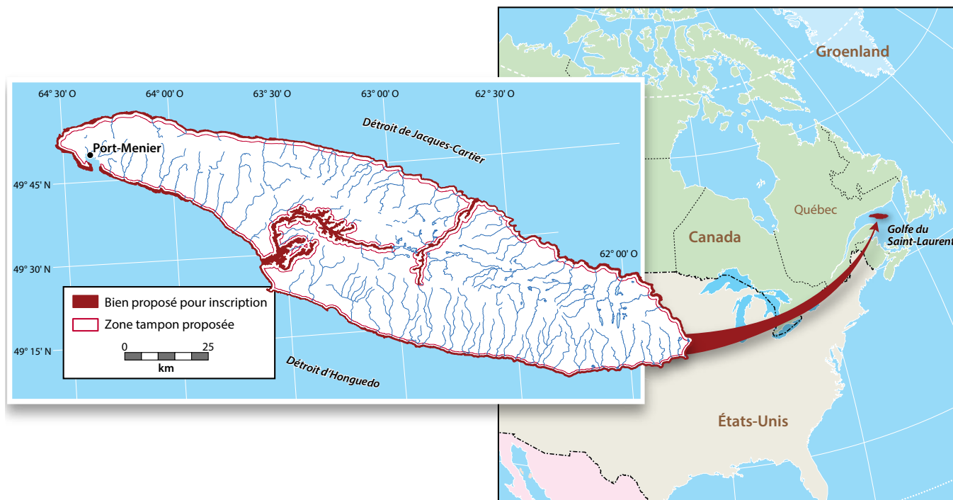
Figure 2. Carte des limites du bien proposé et de sa zone tampon sur le territoire de l'île d'Anticosti (Québec, Canada, Amérique du Nord) (MIA, 2022a, p. 5).