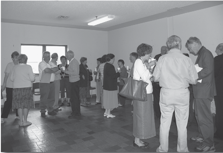
Participants en pause