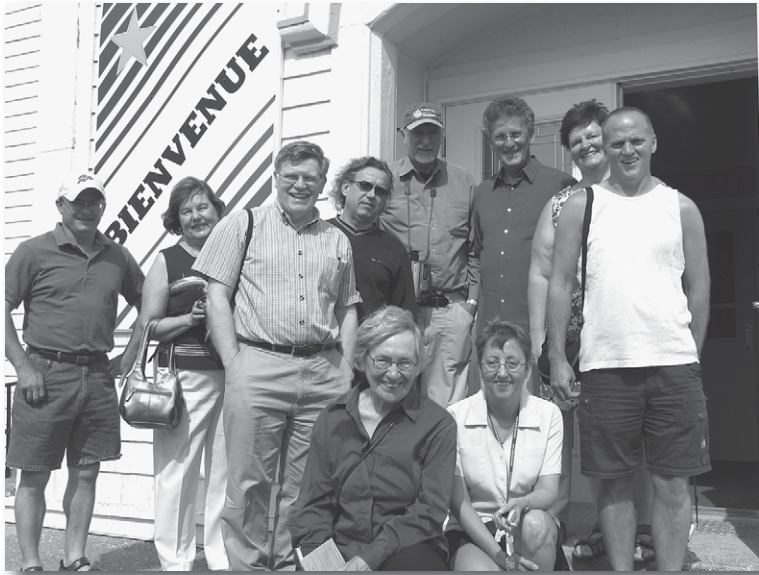
Excursionnistes devant l'église Sacré-Cœur de Saulnierville