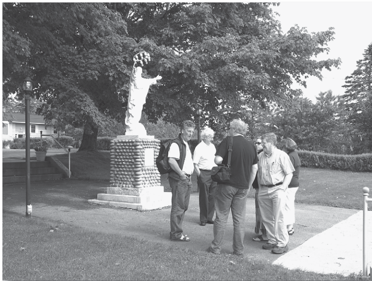
Excursionnistes devant l'église Saint-Pierre de Pubnico-Ouest