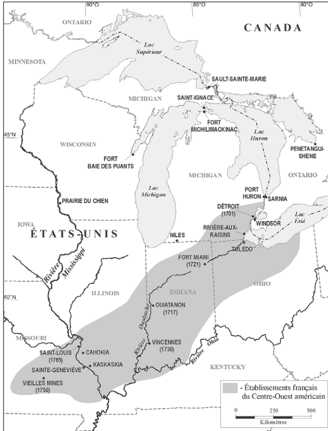
2. Établissements français du Centre-Ouest américain.

Saint-Laurent pour des raisons économiques et ses membres fondent des communautés agricoles à l'est de Windsor, sur la rive sud du lac Sainte-Claire ( ill. 2 ).