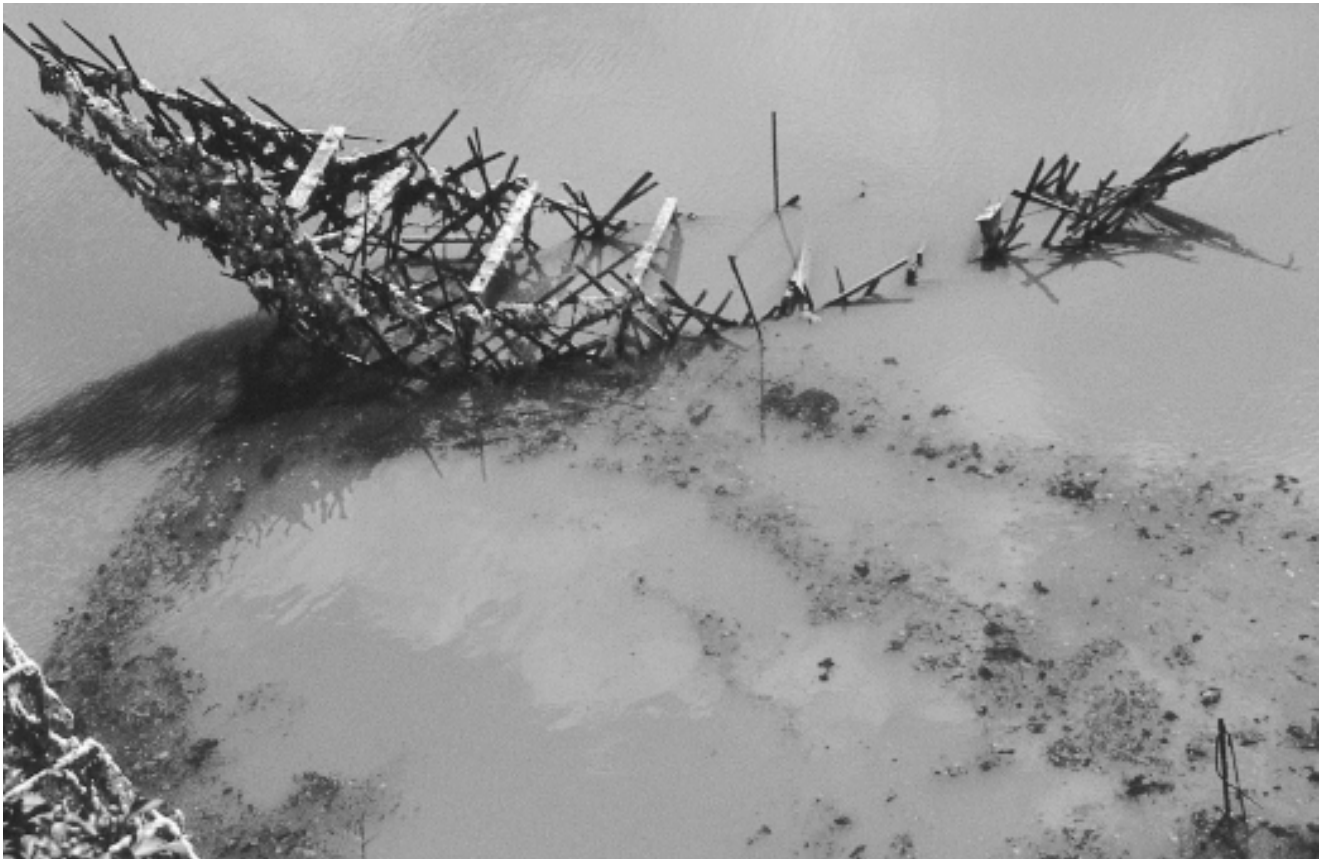
Document photographique (lentilles d'eau rouges), 1999. Recherche photographique/reflets, transformation des éléments du site et des matériaux. Installation à la citadelle de Brouage, France.