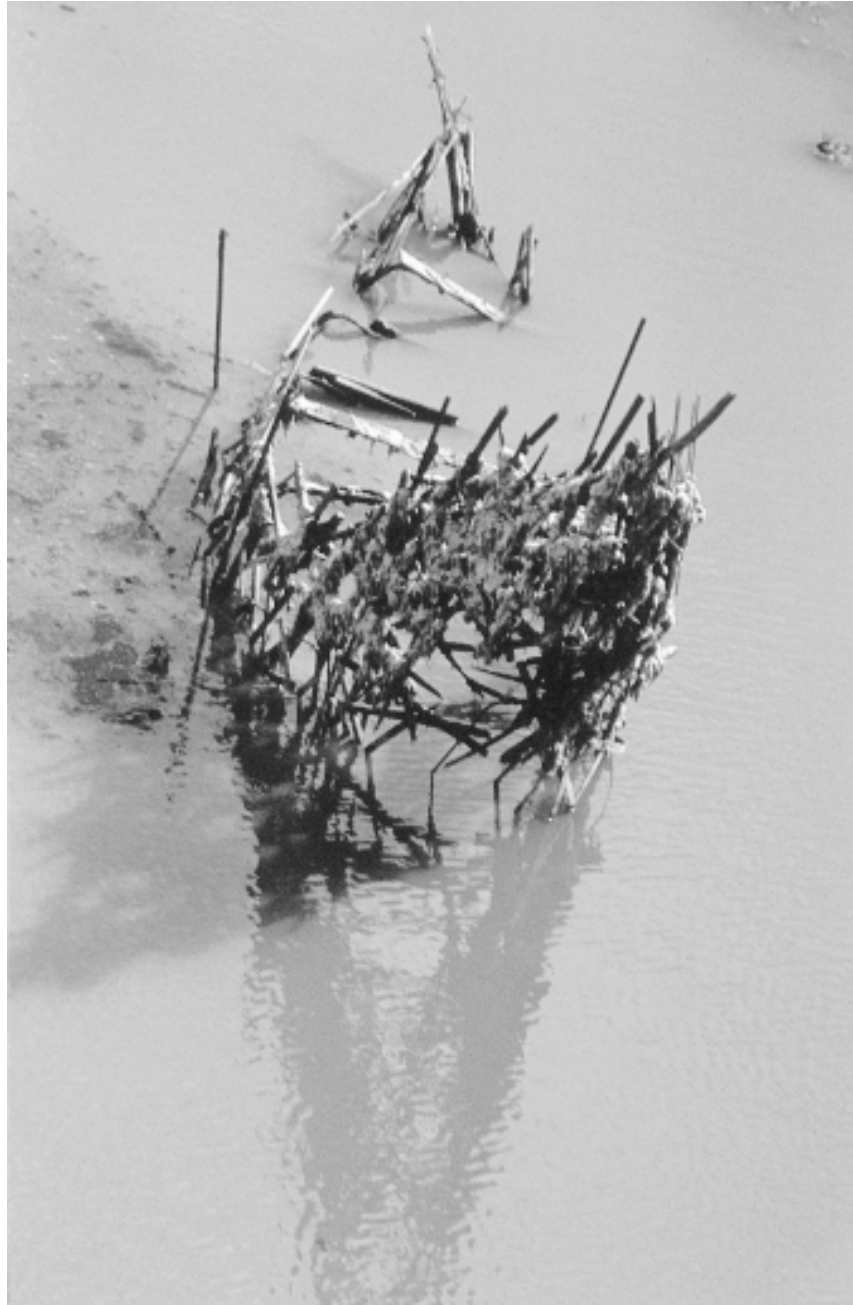
Document photographique (lentilles d'eau rouges), 1999. Recherche photographique/reflets, transformation des éléments du site et des matériaux. Installation à la citadelle de Brouage, France.