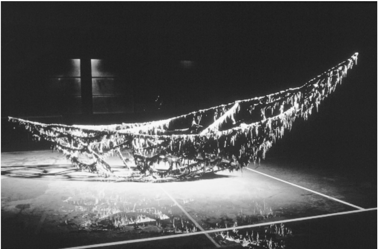
Géographie éphémère, 1999. Grande barque et reflets sur nappe d'eau. Usines Éphémères, Mains d'œuvres, Saint-Ouen, France.