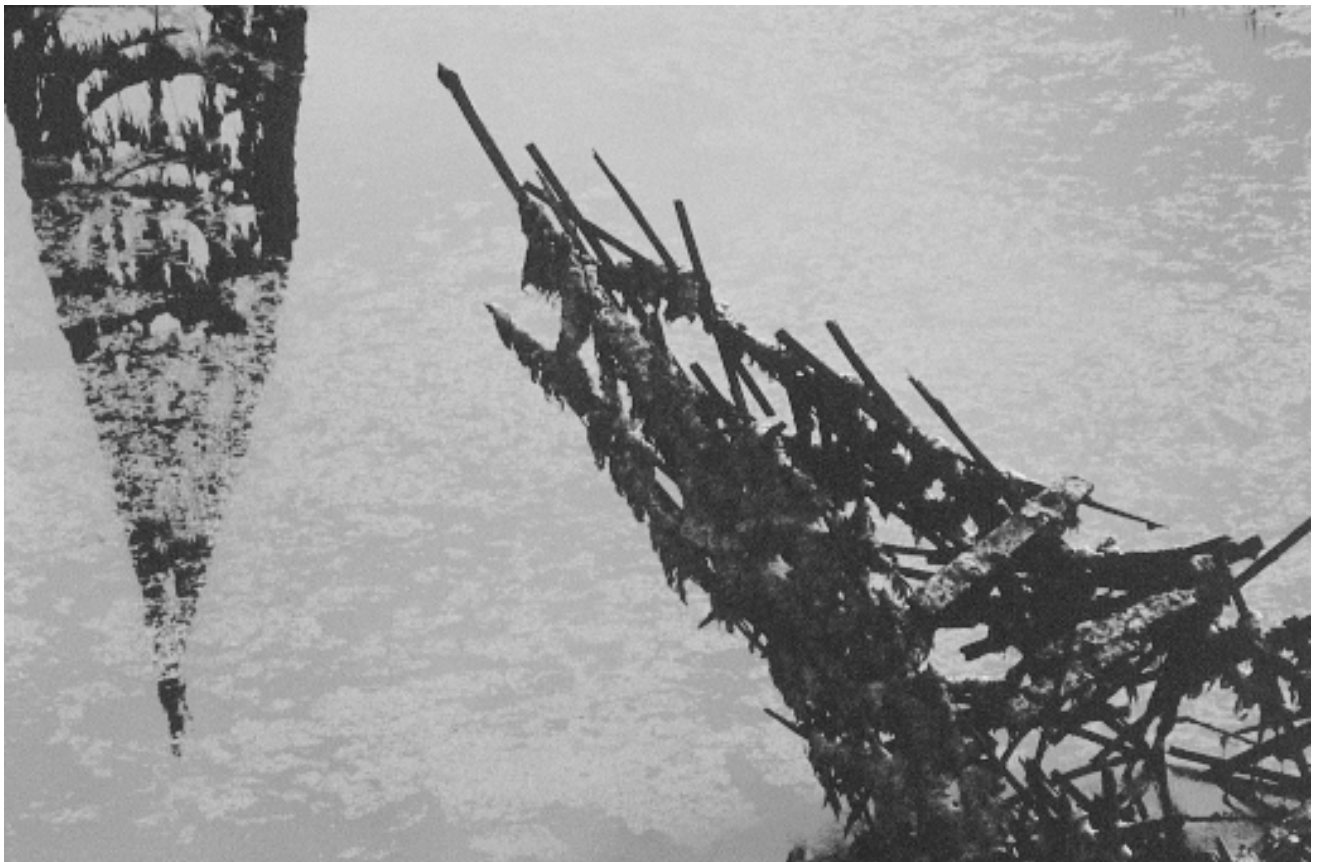
Document photographique (lentilles d'eau vertes), 1999. Recherche photographique/reflets, transformation des éléments du site et des matériaux. Installation à la citadelle de Brouage, France.