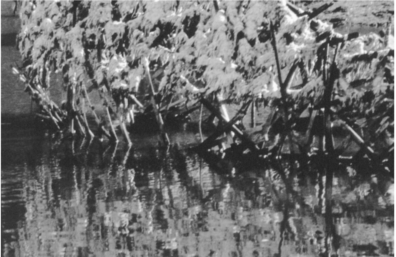
Détail, 1999. Recherche photographique/reflets, transformation des éléments du site et des matériaux. Installation à la citadelle de Brouage, France.