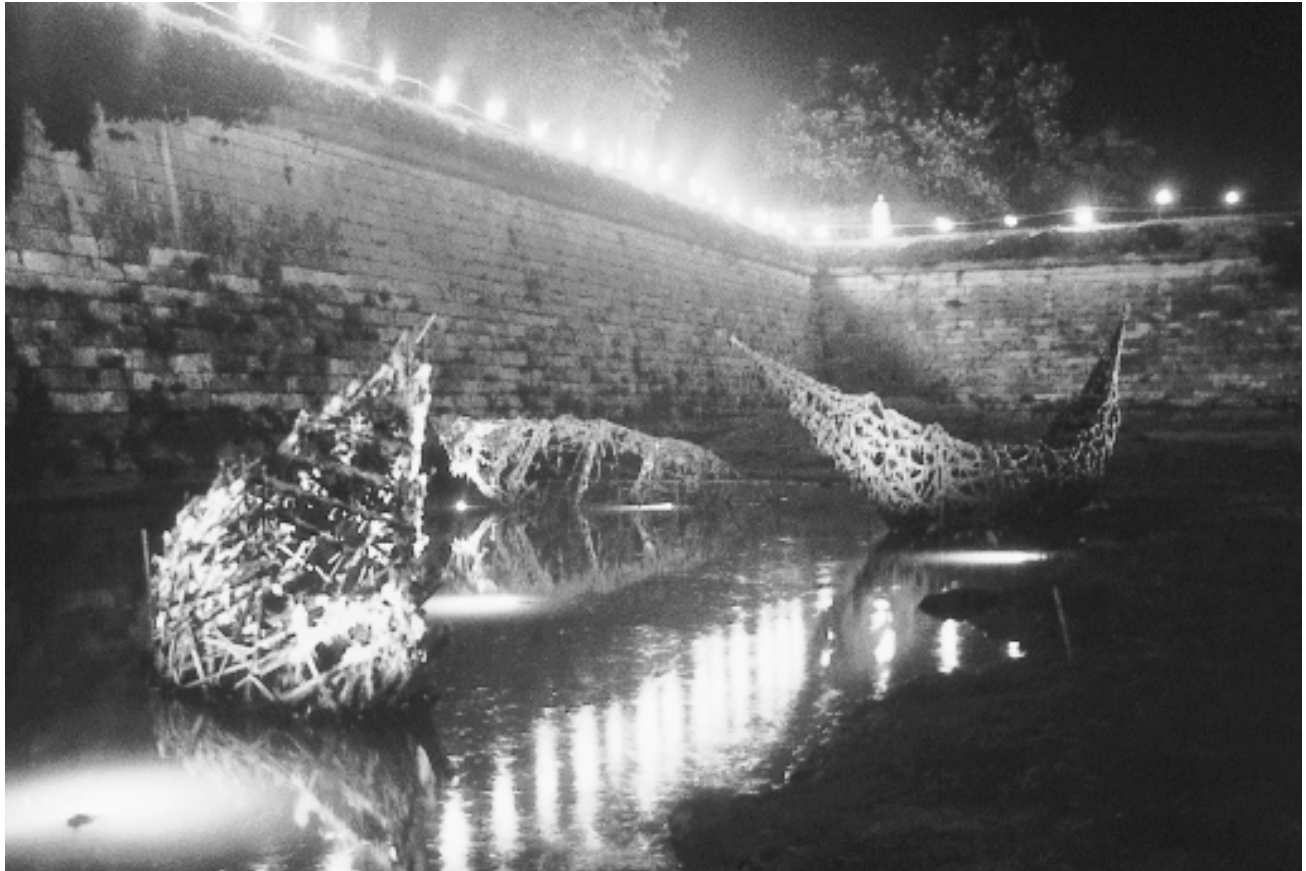
Port de toile ( La magie d'un grand site ), 1998. Deux barques et trois épaves de 5m x 6,5m. Éclairage submersible et hors terre, pots de flamme sur les remparts. Citadelle de Brouage, France.