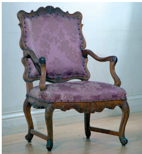
Fauteuil, propriété de l'Hôtel-Musée de la Nation Huron-Wendat