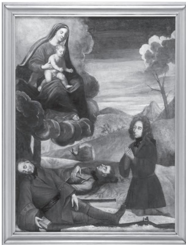
Anonyme, Ex-voto de l'église de Rivière-Ouelle , moitié du XVIII e siècle

Au Québec, nous avons une riche histoire d'œuvres d'art à caractère ethnologique, qui remonte aussi loin qu'à l'époque de la Nouvelle-France. Les ex-voto, par exemple, sont des offrandes créées en remerciement d'un vœu comblé ou d'une grâce obtenue. Ces témoignages de reconnaissance représentent parfois des drames ou des catastrophes au cours desquels l'intervention divine apporte une conclusion plutôt heureuse.