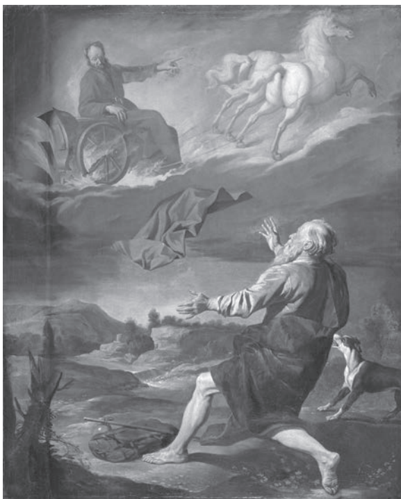
Matthias Stomer (1649-1702), Élie jetant son manteau à Élisée