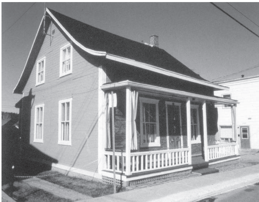
Maison d'Arthur Villeneuve, vers 1992 Avant intégration à la Pulperie de Chicoutimi Photo : Michael O'Malley, Ccq, 1992

Les restaurateurs du Ccq ont contribué au projet en deux volets : en offrant des services d'expertise et de conseils auprès des différents intervenants, pour que les solutions retenues assurent une conservation optimale lors de la relocalisation de la maison ; et en agissant directement sur les surfaces peintes de la maison. Les phases de ce travail ont été partagées ponctuellement entre six restaurateurs sur une période s'étalant sur treize ans. L'œuvre de l'artiste et les projets de restauration pourraient faire l'objet d'une publication ultérieure dans cette revue.