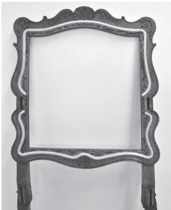
Fauteuil, détail du dossier avec boudin reconstruit

Après avoir été remonté, le siège a été confié à un tapissier afin que ce dernier réalise une garniture traditionnelle. Le choix d'un damas floral comme tissu de couverture a été guidé par le style du meuble et par les textiles liturgiques en cours de restauration. Le rouge, couleur du tissu du siège avant sa restauration, a été maintenu afin de préserver l'attachement de la communauté pour l'objet.