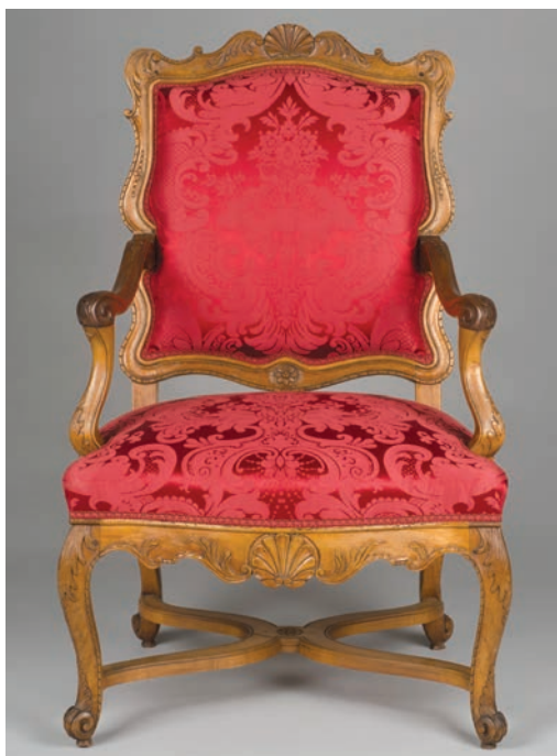
Fauteuil restauré et avec garniture

Photo : Jean-Paul Body, Bibliothèque et Archives nationales du Québec, 1975