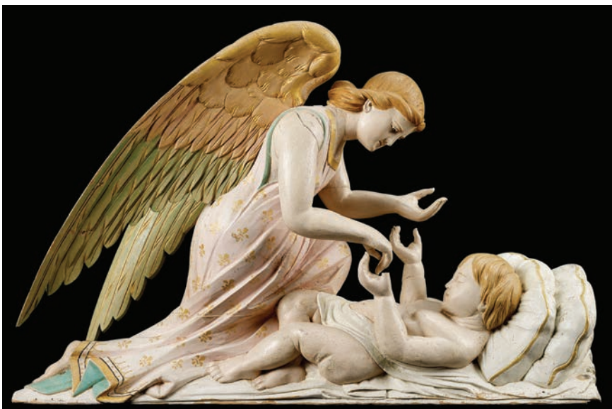
Anonyme, Ange penché sur un enfant , entre 1870 et 1900