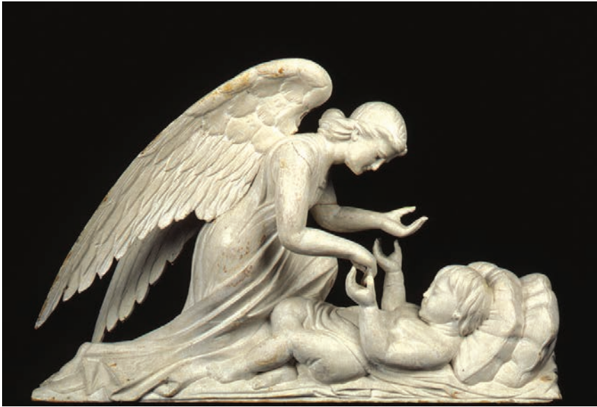
Anonyme, Ange penché sur un enfant , entre 1870 et 1900