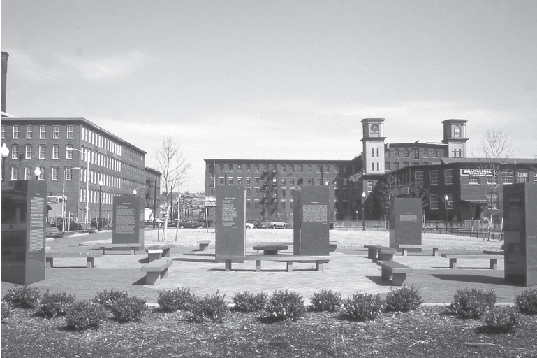
Vue générale du parc Kerouac à Lowell