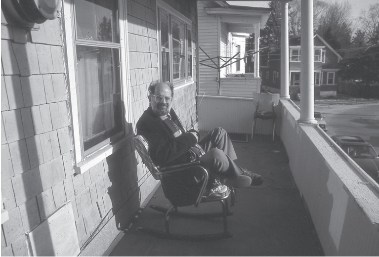
Le poète Allen Ginsberg sur la galerie de la maison natale de Jack Kerouac