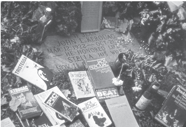
Tombeau de Jack Kerouac, cimetière Edson à Lowell, le 21 octobre 1979 dixième anniversaire du décès de Kerouac