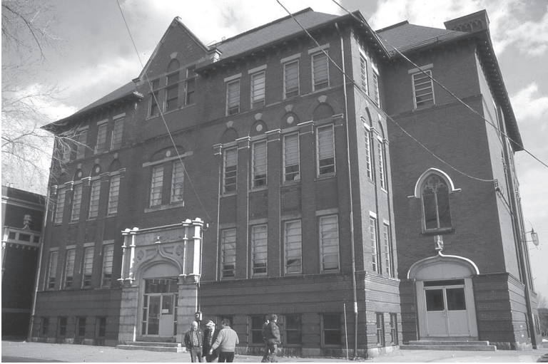
École paroissiale Saint-Louis-de-France