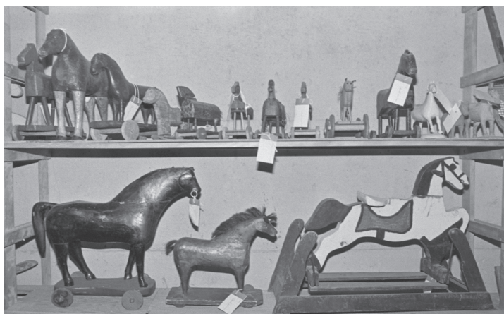
L'École Jean-Godefroy, devenue le Pavillon Robert-Lionel-Séguin en 1983 Rangement et étiquetage des pièces de la collection RLS