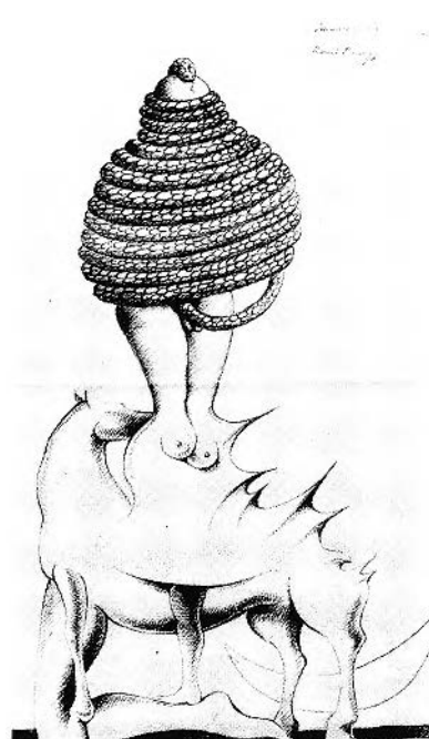
FIGURE 1. Cruzeiro Scixas et Raul Perez, Cadavre exquis , 1972. Coll. privée, Lisbonne (Photo: L. de Moura Sobral).

LUIS DE MOURA SOBRAL (Univ. de Montréal) : Pratiques automatistes chez les surréalistes portugais . L'écriture automatique et les « Cadavres exquis » sont pratiqués dès 1936 par A. Pedro (Fig. 1). Transformations de poèmes traditionnels par l'introduction d'éléments irra-