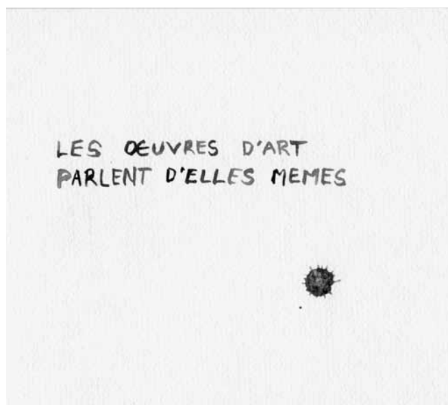
Figure 1. Mathieu Beauséjour, Les œuvres d'art parlent d'elles mêmes , aquarelle sur papier, 2007, collection particulière.

Aussitôt qu'une œuvre d'art exigerait, en dehors de ce doigt-index, une explication particulière, elle deviendrait par là même déjà imparfaite : puisque la première exigence du beau est cette clarté par laquelle il se déploie devant les yeux. 6