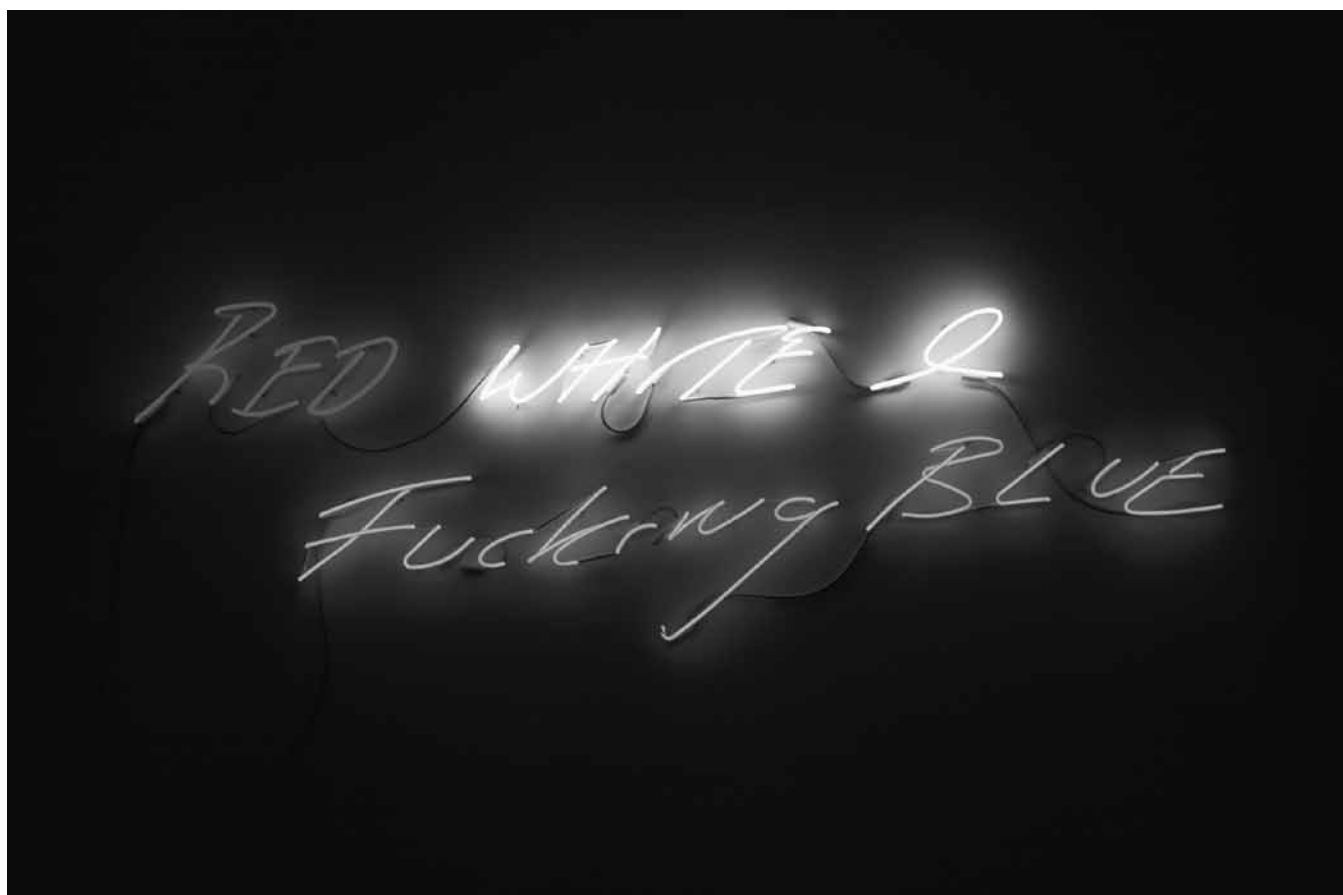
Figure 4. Tracey Emin, Red, White & Fucking Blue , 2004. Néon, 74,5 x 237 cm. Londres, White Cube (crédit photographique : © Tracey Emin. Courtesy White Cube).

prédécesseur, et l'intrusion du langage familier, en l'espèce du mot fucking . Plus que par sa charge transgressive, l'occurrence de ce mot étonne surtout par l'émotivité qu'implique son usage. Sans compromettre la circularité logique de l'œuvre, le terme y introduit une strate de signification qui l'enrichit, et donc la complique. Il relève moins d'un usage constatatif que d'un registre expressif du langage, indice et trace de l'affect dans la parole. Il est à cet égard un exemple patent de ce « langage privé » auquel faisait allusion dans son article Rosalind Krauss, en s'inspirant de Wittgenstein : un langage fait de mots renvoyant à des sensations et affects purement idiosyncrasiques. De fait, en l'absence de tout contexte, le terme fucking élude toute référence précise : il pourrait aussi bien signifier l'exaspération, la colère, la lassitude ou la frustration que l'ennui 37 . Un tel recours au langage cru — qui concorde avec la veine autobiographique qui imprègne le travail de l'artiste britannique — est renforcé par le recours à l'écriture manuscrite, qui indexe l'action du corps et évoque quelque note tracée hâtivement sur un bout de pa-