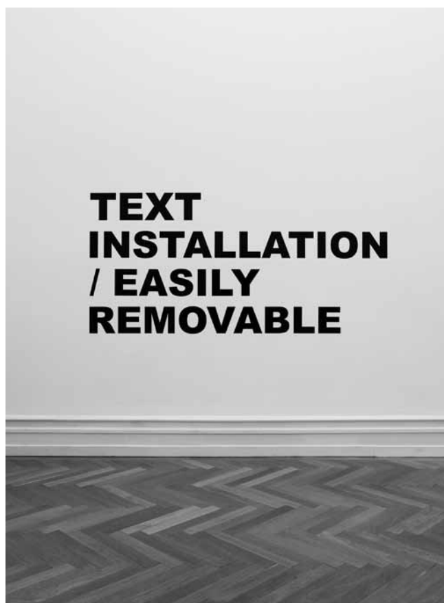
Figure 7. Stefan Brüggemann, Text Installation / Easily Removable , 2001. Lettrage vinyl (crédit photographique : Courtesy Stefan Brüggemann).