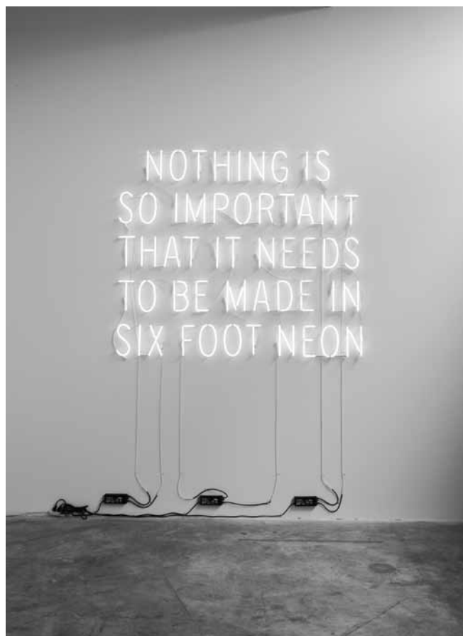
Figure 5. Kelly Mark, Nothing Is So Important That It Needs To Be Made In Six Foot Neon , 2009. Néon et transformateur, approximativement 183 x 183 x 5 cm. Collection de l'artiste (fabrication du néon : Orest Tataryn).

l'écart le plus net vient de ce que, à la différence des propositions analytiques visées par Kosuth, la phrase est l'expression d'une opinion, c'est-à-dire d'un jugement de valeur, en tant que tel sujet à débat. Or le principe qu'édicte l'œuvre tourne à son détriment, et doublement : ou bien l'œuvre est appréciée, s'attirant le rire et la connivence du spectateur, et c'est son énoncé qui est invalidé, puisqu'il valait donc la peine de la fabriquer en néon de six pieds, — et l'œuvre a tort; ou bien l'énoncé est pris au pied de la lettre, et c'est alors l'œuvre qui se voit dépréciée, comme si elle péchait par orgueil en se croyant digne de mériter une telle fabrication, et l'œuvre a tort encore une fois. On pourrait à ce titre y voir une astucieuse variation sur le paradoxe du menteur, s'embrayant ici par l'applicabilité contradictoire de l'énoncé et de l'énonciation, mais aussi peut-être une vanitas contemporaine employant les moyens du spectacle et de la marchandise pour dénoncer ceux-ci. C'est d'ailleurs le sens qui se dégage des propos de l'artiste,