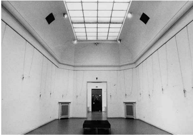
Figure 1. Silence , 1988, Hagen, Osthaus Museum. Commissaire: Michael Fehr.