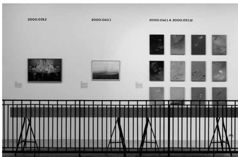
Figure 5. L'Inventaire, vol. 7 – acquisitions de 1999 à 2000, 2017, Frac Normandie Rouen. Commissaire: Véronique Souben.