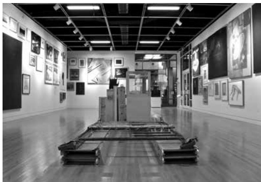
Figure 6. As much as possible given the time and space allotted, 2009, Montréal, Galerie Leonard & Bina Ellen, Université Concordia. Commissaires: Rebecca Duclos et David K. Ross. Vue prise le 9 avril 2009.