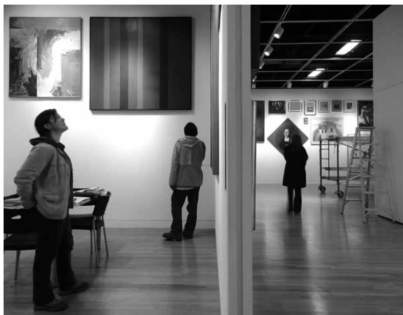
Figure 7. As much as possible given the time and space allotted, 2009, Montréal, Galerie Leonard & Bina Ellen, Université Concordia. Commissaires: Rebecca Duclos et David K. Ross. Vue prise le 4 avril 2009.