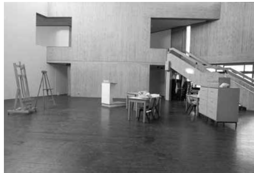
Figure 3. Revision [vue d'accrochage], Hagen, Osthaus Museum, 1988. Commissaire: Michael Fehr.