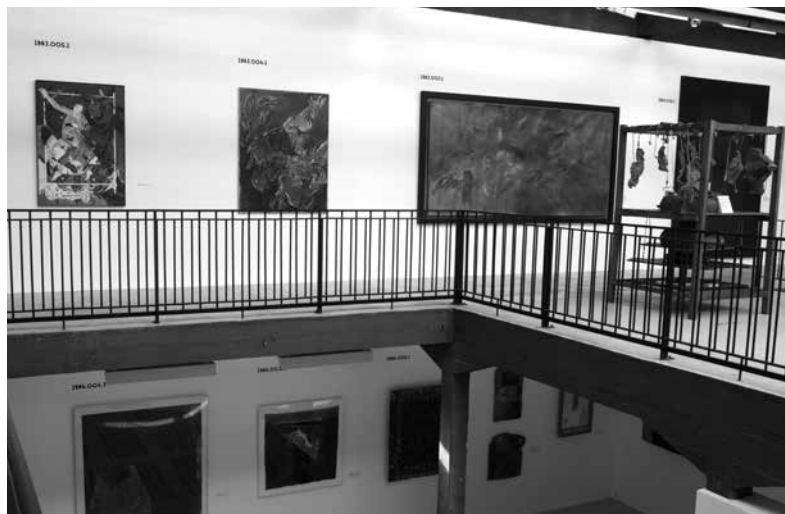
Figure 4. L'Inventaire, vol. 1 – acquisitions de 1983 à 1984, 2011, Frac Normandie Rouen. Commissaire: Véronique Souben.