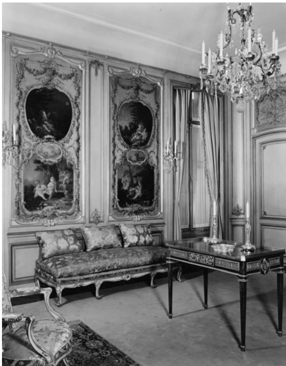
Figure 5. Salle Boucher ( Boucher Room ), France, milieu du xviii e siècle, pièce telle que mise en exposition en 1940, The Frick Collection, New York.