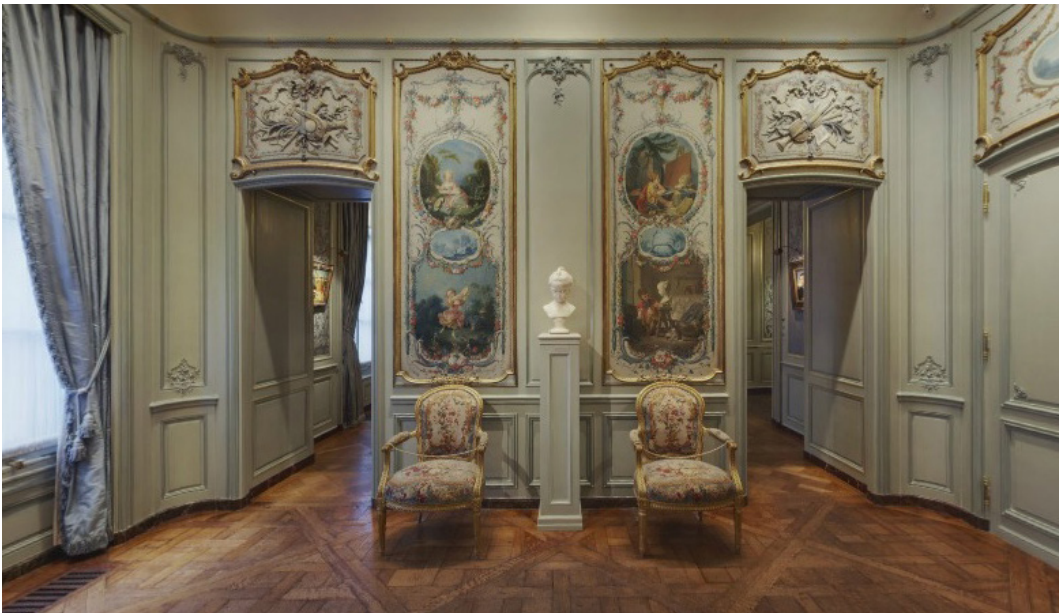
Figure 1 (haut). Salle Boucher (Boucher Room), vue du manteau de cheminée, France, milieu du xviii e siècle, pièce telle que montrée sur le site Internet du musée, The Frick Collection, New York.