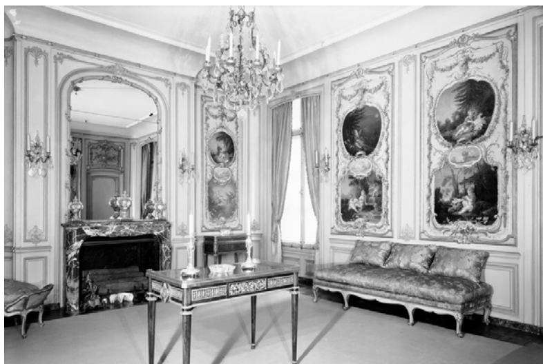
Figure 6. Salle Boucher ( Boucher Room ), France, milieu du xviii e siècle, pièce telle que mise en exposition en 1953, The Frick Collection, New York.