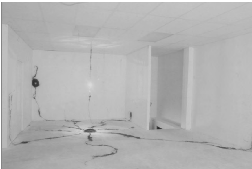
« Au nom de la terre (le cœur de la Terre-Mère) », 1997. Partant du cœur de la mère, des racines courent sur le sol et les murs

Un signe? Sûrement pour l'artiste, qui accorde énormément d'importance à tout ce qui se manifeste dans et autour de sa création. Nous y revenons plus loin. Ajoutons un dernier détail. Dans le catalogue de l'événement, on constate que les auteurs qui commentent cette œuvre s'expriment différemment quant au nombre de mâts installés, au nombre de ceux qui ont résisté, et même à savoir lesquels. Tout cela nous rappelle bien que toute interprétation des faits et de l'histoire est sujette à caution. Les discours varient.