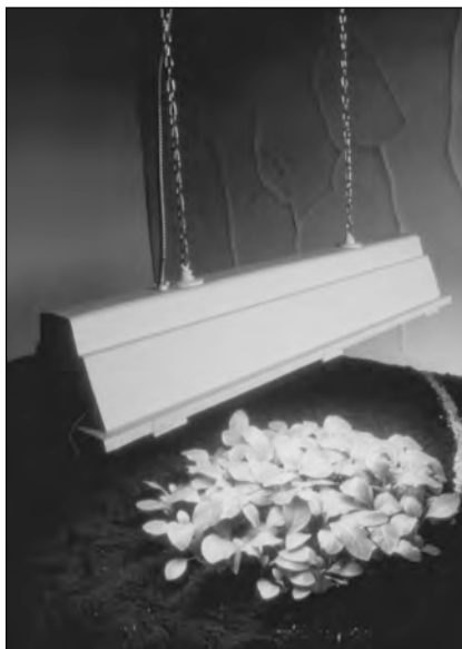
« Je donne le tabac », 1997. Semis de tabac dans la salle 2