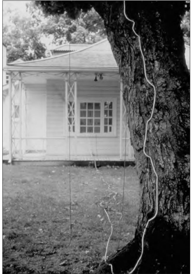
« Prière », 2000. Des colliers de prière coulent de la cime d'un grand érable

L'arbre, exploité de manière spectaculaire dans « L'arbre sacré », revient tout en assurance, en recueillement et en sagesse dans « Prière », lors de l'événement Artboretum tenu à la Maison Hamel-Bruneau pendant la Biennale d'art actuel en 2000. Dans « L'arbre sacré », le cèdre qui perfore la paroi entre deux espaces semble moins vouloir réunir deux lieux que croître entre les deux : d'un côté du mur, en effet, les racines arrachées flottent au-dessus du sol tandis que de l'autre, le tronc et la cime se redressent immédiatement le long de la cloison et tendent vers le haut, comme si l'arbre prenait appui sur cette frontière, sur ce déséquilibre, pour mieux prendre son envol entre deux mondes en quête d'un univers unique qui lui serait propre. Transgressant au contraire les frontières pour mieux sceller leur abolition, « Prière » a clairement dessein de fusionner l'intérieur et l'extérieur des choses et des êtres, et de montrer la possible convergence de regards nés de points de vue différents sur le monde. Partant de la blessure d'un grand érable croissant sur le parterre, Robertson laisse couler sur son écorce six colliers de prière composés au total de quelque 40 000 perles enfilées une à une et marquées chacune d'une lettre d'un poème africain glorifiant l'arbre. Leurs six couleurs signifient les quatre directions (jaune Est, noir Ouest, blanc Nord et rouge Sud)