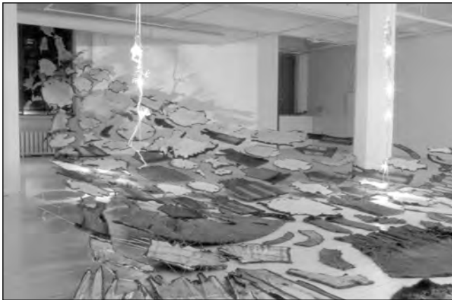
« Dialogue entre Elle et moi à propos de L'esprit des animaux », 2002. Une volée de peaux qui glissent vers l'ouest évoquent aussi un banc d'animaux marins.

1991 à l'aide de la théorie de Fernande Saint-Martin (1987). L'investigation d'une œuvre par analyse syntaxique nous renseigne sur la manière dont l'artiste perçoit la réalité et négocie les tensions de sa vie psychique en s'exprimant dans son œuvre. Nous sommes ici davantage sur le terrain de la culture que sur celui de l'ethnicité car l'étude des représentations autochtones et de la psychologie des sujets est aussi celle du processus de transformation de l'identité amérindienne.