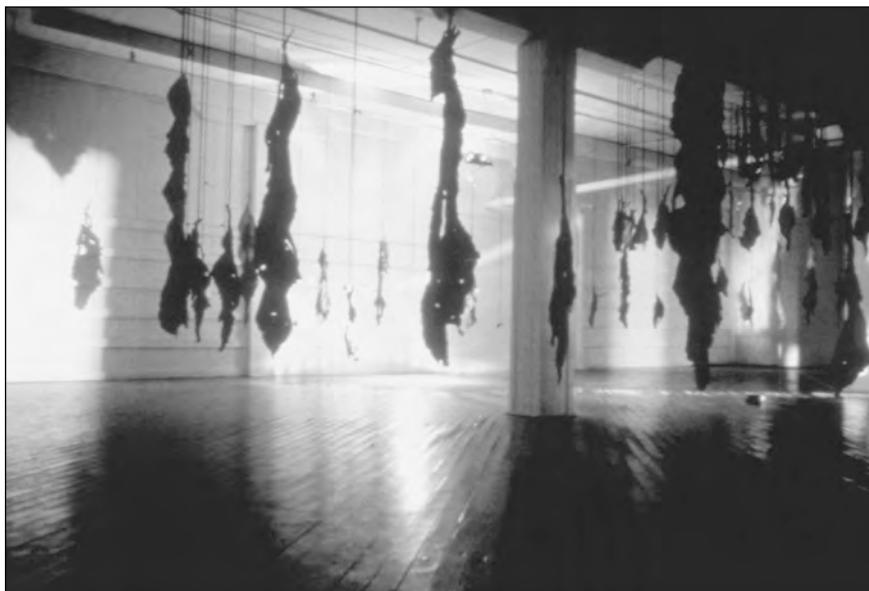
« Je donne le tabac », 1997. Dans la salle 1, des feuilles de tabac forment une spirale suspendue