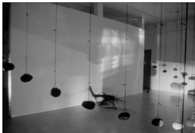
« L'arbre sacré », 1995. Dans la salle 2, les racines du cèdre sont entourées par le cercle féminin des pierres suspendues entre ciel et terre