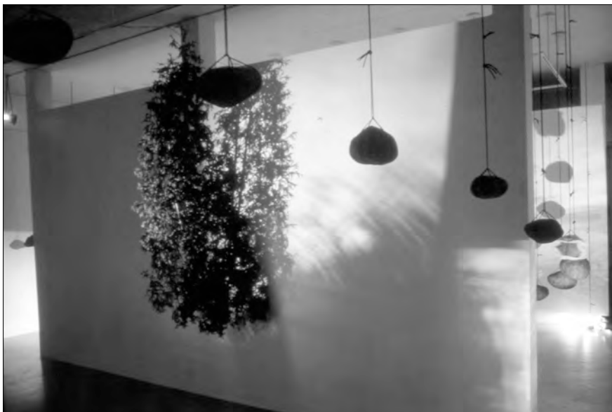
« L'arbre sacré », 1995. Dans la salle 1, la cime d'un cèdre représentant l'Esprit innu crève le mur de la salle tandis que ses racines se déploient dans la salle 2

hétérogènes qui le renvoient aux musées d'ethnologie. La hiérarchie et l'individualisation prennent alors forcément le pas sur le consensus et le collectif. Doit-on parler pour autant d'acculturation? Ou s'agit-il de réappropriation culturelle? À ce sujet, la démarche de Sonia Robertson est très informative. Cette artiste innue fait usage dans ses œuvres de codes et de stratégies dont il est difficile de trancher s'ils relèvent d'une tradition autochtone ou de l'esthétique contemporaine internationale. Elle se définit d'abord comme artiste. Pourtant, son travail est extrêmement connotatif et manifeste sans contredit la culture de ses ancêtres. Née en 1967 à Mashteuatsh, cette créatrice multidisciplinaire s'intéresse à la musique, étudie la photographie et le cinéma, puis complète un baccalauréat interdisciplinaire en arts à l'Université du Québec à Chicoutimi en 1996. Son curriculum comporte plusieurs expositions individuelles d'œuvres avant tout installatives, éphémères. Elle participe à de nombreux collectifs et symposiums, surtout au Québec, mais aussi au Japon, en Haïti et en Allemagne.