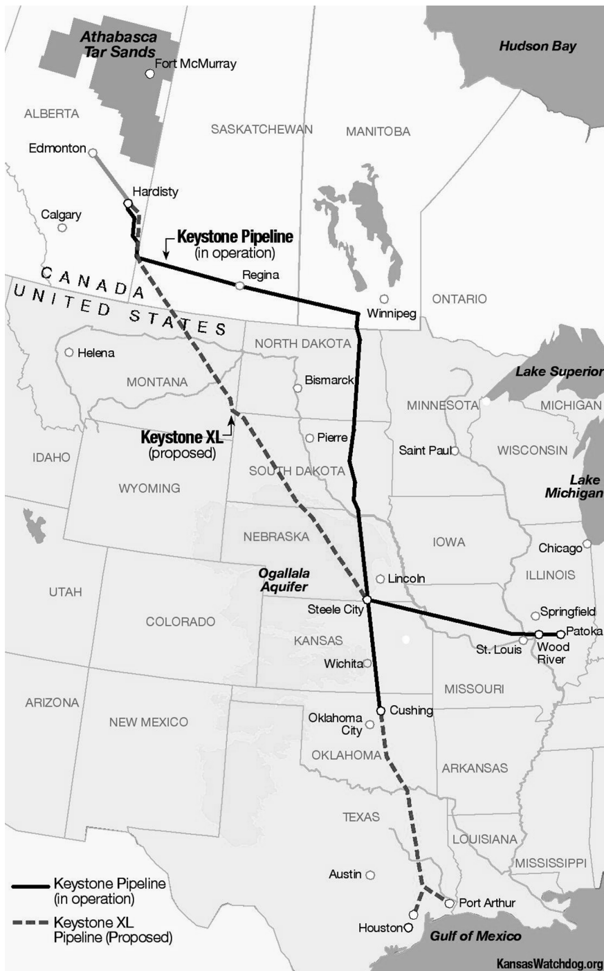
Tracé du projet de pipeline Keystone XL jusqu'au golfe du Mexique