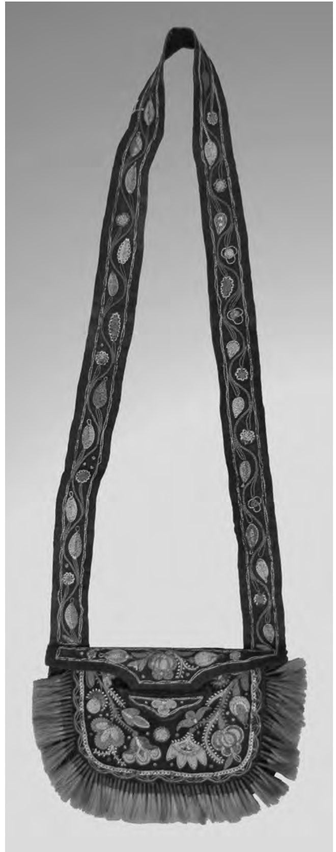
Figure 6 Sac à fond de forme ronde porté en bandoulière, d'attribution huronwendate, legs du baron Adalbert von Barnim, datant d'avant 1859. Cuir, poils d'original et de chevreuil, fer étamé, ruban de soie, fil de coton. Largeur 19,8 cm (Ethnologisches Museum, Berlin, Allemagne, n° cat. IX D 469. Photo de Nikolaus Stolle)

Le sixième et dernier sac, décrit en détail, a été légué par le baron Adalbert von Barnim, mort en 1859, à l'ancien Königliches Museum für Völkerkunde à Berlin, désormais appelé Musée ethnologique de Berlin (n° de cat. IX D 469) [fig. 6]. Le sac est en cuir nettoyé à l'aide d'un outil émoussé, teint en noir, de forme mi-arrondie, dont le devant est plus petit que le dos, et mesurant 14 cm sur 19,8 cm. L'extrémité supérieure du dos est allongée de façon à former un rabat pentagonal aux pointes arrondies retombant sur le devant, où ce rabat s'insère dans une fente bordée d'une petite applique ondulée et triangulaire en cuir. Le rabat était jadis fixé à l'aide d'un ruban de soie rose (Krickeberg 1954 : 125, tab. 32b) 3 . Le bas et les côtés du devant sont bordés de cônes étroitement attachés remplis de poils de chevreuil teints en rouge. Deux rangées, composées respectivement d'une bande en zigzag blanc et de lignes ondulées rouges entrecoupées de cercles bleus, encadrent trois côtés du motif central. Ce dernier représente plusieurs fleurs et feuilles orientées vers le bas, encadrées