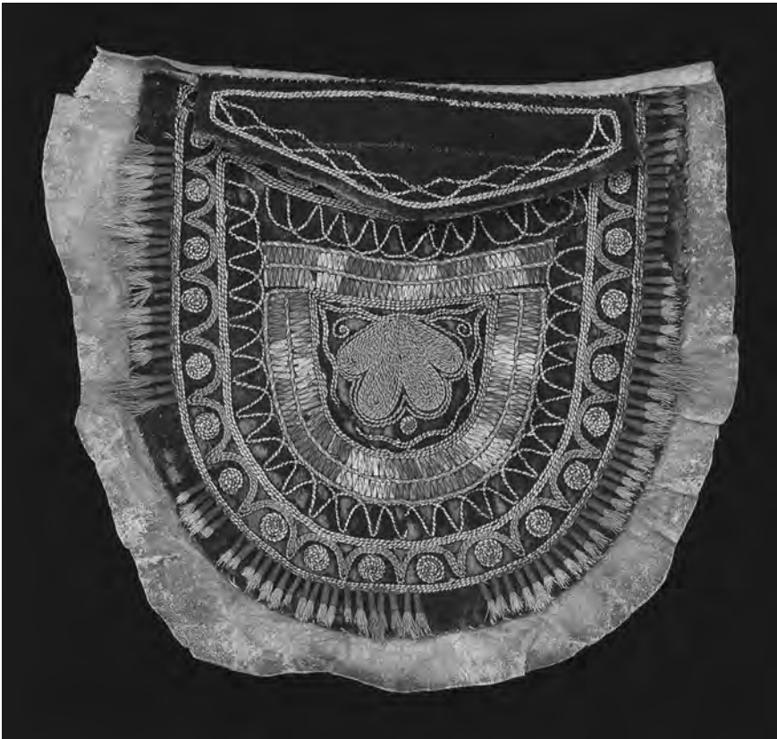
Figure 1 Sac à fond de forme ronde, probablement huron-wendat, peut-être acquis par Charles, premier marquis et second comte Cornwallis (1738-1805) Peau de chevreuil tannée à la cervelle, poils d'orignal et de chevreuil, piquants de porc-épic, fer étamé, tendon. Largeur 21,6 cm (Collection Thaw, Fenimore Art Museum, Cooperstown, New York, n° cat. T280.)