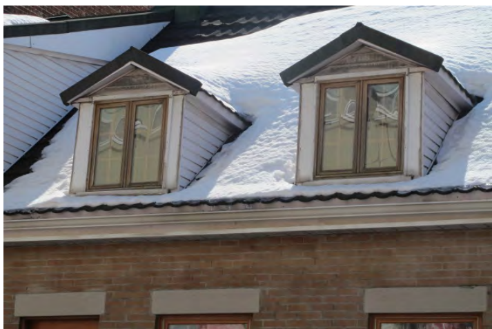
Illustration 2 : Exemple d'une photo explicitement prise en raison du toit mansardé (projet MV2015)

Ainsi, si la présence de ces premiers éléments ne m'étonnait pas, car ils illustraient des définitions préalables et mes expériences passées, je fus surprise en revanche par le nombre et la variété de photographies prises dans la perspective de définir le patrimoine à travers des éléments particuliers de l'architecture du quartier : portes cochères, toits mansardés, corniches (exemple en illustration 2). Mais là encore, la motivation exprimée par les « artistes » de ces clichés résidait dans le fait que ces corniches, portes (rouillées pour la plupart) et toitures leur semblaient « anciennes » ou « vieilles » ou encore « belles ». Bien que ce dernier adjectif ne semble pas s'inscrire dans le noyau central (Abric, 2003) du concept de patrimoine, je tenais à l'évoquer tout de même, car il atteste d'une certaine poésie dont j'avais déjà été témoin dans l'édition 2014. Ainsi, le patrimoine, ça peut être « des belles choses ».