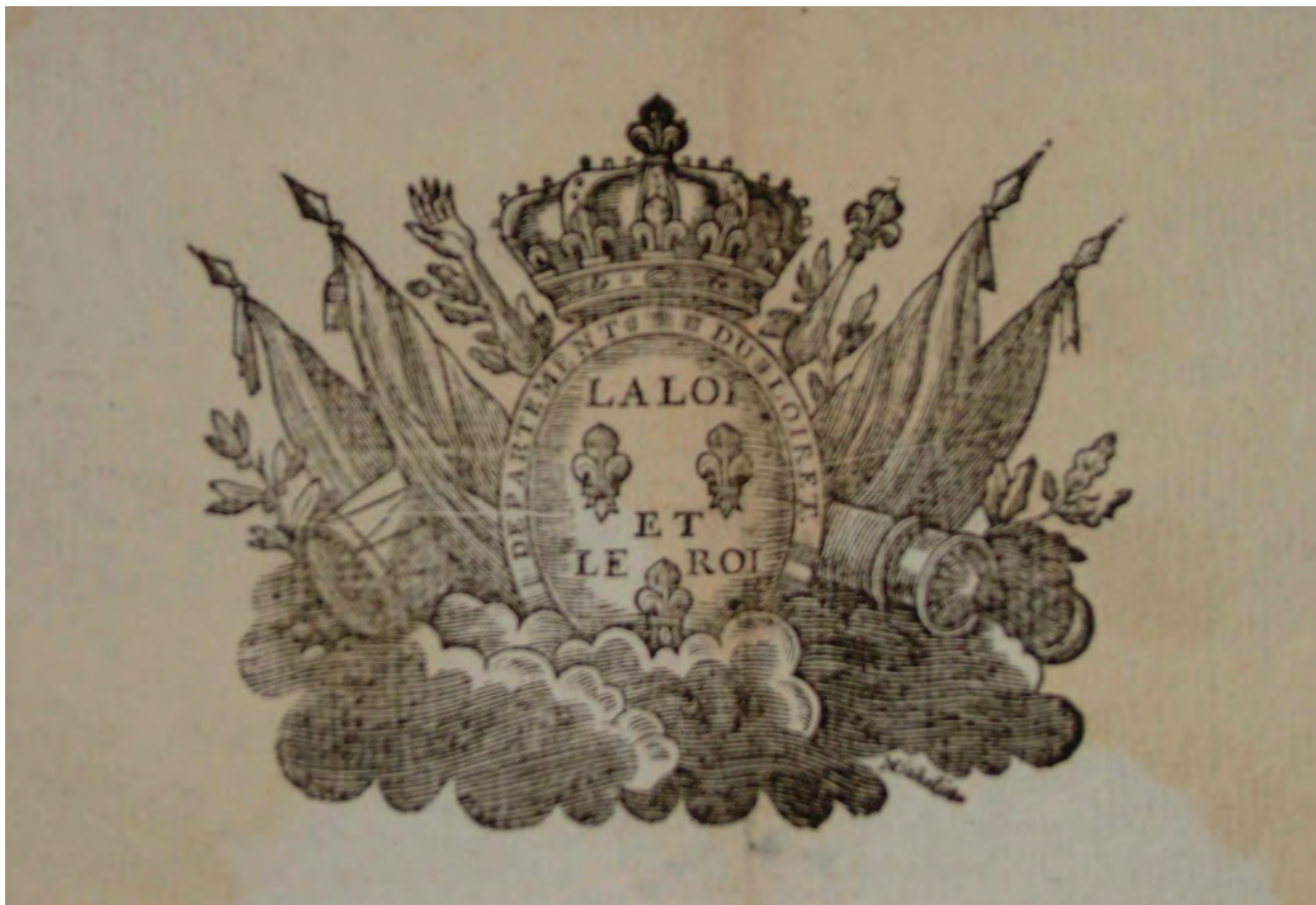
Illustration 2 : L'image du décret de l'Assemblée nationale du 21 Juin 1791, « Au sujet de l'enlèvement du Roi et de sa famille »

d'étude de documents à partir des documents des archives du Loiret et pour Les Rendez-vous de l'Histoire de Blois de 2007 dont le thème était : « L'Opinion : information, rumeur et propagande ». L'image utilisée (voir illustration 2) doit permettre de répondre à la question sept : « Quels sont les deux pouvoirs nationaux qui apparaissent dans ce document ? » La réponse attendue par l'enseignant est : « Le pouvoir législatif ("la loi") et le pouvoir exécutif ("le roi"), représenté par les fleurs de lys, la couronne, le sceptre et la main de justice. Comme le souligne l'ordre des mots utilisés c'est le législatif qui a la prééminence sur l'exécutif. » L'image du décret est utilisée dans cette séquence pour rappel des pouvoirs en France à l'époque, elle n'est pas analysée comme moyen de comprendre la fiction de l'enlèvement créée pour l'Assemblée afin d'éviter une crise institutionnelle 8 . Le document iconographique est cependant présenté, ce qui permet une première lecture de l'image avec le relevé des symboles (la fleur de lys, par exemple). L'auteur, de fait, utilise la grille de Gervereau pour la description technique et en partie thématique, mais il n'y a pas de relation entre l'image et le texte.