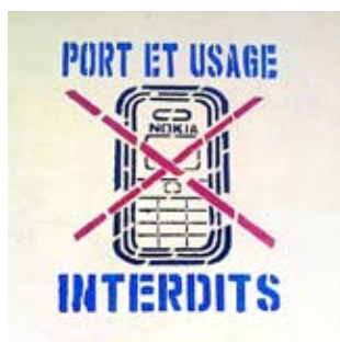
Figure 1. Image portant interdiction des téléphones portables à l'école au Bénin.

Mieux, selon Kiyindou et Bautista (2011), l'individu n'a de cesse d'intervenir, de ruser, de s'accommoder, de transformer le réel, de changer les lois, d'inventer des règles, de s'arranger avec la vie.