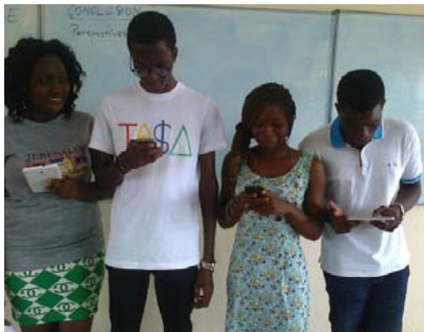
Figure 3. Image d'une observation directe de classe : utilisation de téléphones mobiles et de mini-tablettes pour exposer un travail collaboratif.

Les avis exprimés par les répondantes ici ne dévoilent pas non plus des usages convaincants des supports mobiles, si ce n'est de traduire leur « envie » et leurs « attentes » en termes d'autorisation et de démocratisation de l'utilisation des supports mobiles dans les universités pour supporter et soutenir l'enseignement, l'apprentissage et l'évaluation des savoirs, des savoir-faire, des savoir-être, etc.