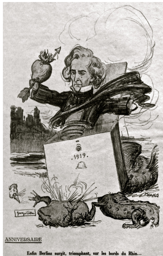
Figure 3b : Georges Villa, « Anniversaire. Enfin Berlioz surgit, triomphant, sur les bords du Rhin... », Le Courrier musical , vol. 21, n° 6 (15 mars 1919), n. p.