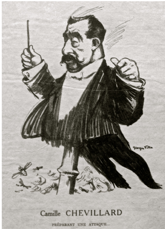
Figure 3a : Georges Villa, « Camille Chevillard préparant une attaque... », Le Courrier musical , vol. 21, n° 5 (1 er mars 1919), n. p.