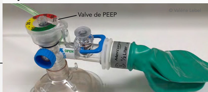
Image 3 - Ballon d'anesthésie.

D'autres composantes peuvent être ajoutées au ballon-masque autogonflable, tel que la valve de pression positive (PEEP- positive end expiratory pressure ). La valve de PEEP favorise le recrutement alvéolaire augmentant ainsi les échanges gazeux, ce qui permet d'améliorer l'oxygénation (7). Si une valve de PEEP est utilisée, il est recommandé d'effectuer la titration à partir de 5 cmH 2 O, et ce, jusqu'à 15 cmH 2 O, sans toutefois dépasser 20 cmH 2 O. Une pression excessive accroît le risque d'ouvrir le sphincter gastro-œsophagien, augmentant ainsi les risques d'insufflation gastrique et de vomissements, en plus d'augmenter le risque de barotraumatismes (lésions pulmonaires) (5,7).