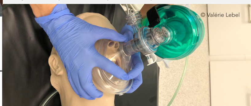
Image 8 - Technique de ventilation par ballon-masque à deux intervenants.

La technique à deux intervenants est toutefois considérée comme étant la plus efficace et permet d'assurer une meilleure étanchéité du masque (4, 5, 7, 8). Elle s'avère plus utile lorsque la ventilation est difficile, par exemple avec des personnes obèses (4). Cette technique consiste à avoir un premier intervenant qui se trouve à la tête du patient et qui maintient l'étanchéité du masque en appliquant une légère pression avec ses deux mains de part et d'autre du masque en formant la lettre «C» à l'aide de ses pouces et de ses index (4, 5, 7, 8). Les six autres doigts, soit le majeur, l'annulaire et l'auriculaire des deux mains, sont alors placés sous la mandibule pour permettre le soulèvement de la mâchoire ou la subluxation mandibulaire en formant la lettre «E» (voir image 8) (4, 5, 7, 8). Le deuxième intervenant, quant à lui, s'occupe principalement de comprimer le ballon insufflateur à deux mains (4, 5, 7, 8).