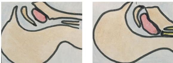
Image 1 - Affaissement de la langue chez une personne inconsciente.

Image inspirée de Vo et al. (4). © Lysane Paquette