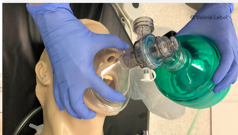
Image 7 - Technique de ventilation par ballon-masque à un intervenant.

La technique à deux intervenants est toutefois considérée comme étant la plus efficace et permet d'assurer une meilleure étanchéité du masque (4, 5, 7, 8). Elle s'avère plus utile lorsque la ventilation est difficile, par exemple avec des personnes obèses (4). Cette technique consiste à avoir un premier intervenant qui se trouve à la tête du patient et qui maintient l'étanchéité du masque en appliquant une légère pression avec ses deux mains de part et d'autre du masque en formant la lettre «C» à l'aide de ses pouces et de ses index (4, 5, 7, 8). Les six autres doigts, soit le majeur, l'annulaire et l'auriculaire des deux mains, sont alors placés sous la mandibule pour permettre le soulèvement de la mâchoire ou la subluxation mandibulaire en formant la lettre «E» (voir image 8) (4, 5, 7, 8). Le deuxième intervenant, quant à lui, s'occupe principalement de comprimer le ballon insufflateur à deux mains (4, 5, 7, 8).