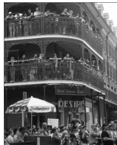
Touristes, Nouvelle-Orléans.

Al Rose prétend que ce type de bal était plus couru que les attractions plus conventionnelles entourant les parades des Krewes of Rex, Comus et Momus (Rose: 64) et que les invitations gratuites pour les femmes étaient fort difficiles à se procurer car même les jeunes femmes de la bonne société intriguées par cette mode cherchaient à y participer profitant des masques pour ne pas se faire reconnaître. Il ne faudrait pourtant pas croire que tout les résidents de la Nouvelle-Orléans appréciaient ce quartier. Loin s'en fallait. Mais, tout comme aujourd'hui dans le vieux Carré où les habitants se plaignent des nuisances que procurent la rue Bourbon et les hordes de touristes se massant pour le Carnaval autour de la Cathédrale St-Louis, les résidents de la Nouvelle-Orléans, d'il y a un siècle, souffraient ce quartier légalisé qui rapportait un essor économique à la ville.