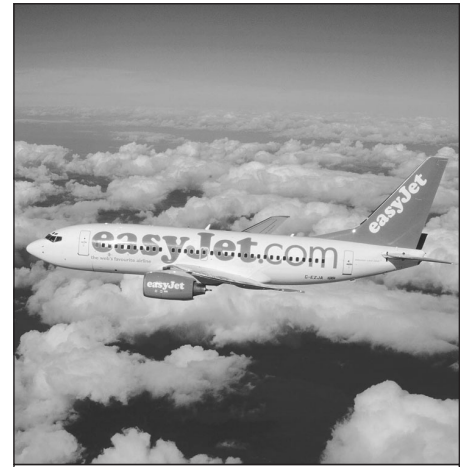
Un Boeing 737-700 de la compagnie à bas prix EasyJet.

Au titre des coûts d'exploitation et sous un angle endogène, les low cost exercent à partir d'aéroports dits désormais de proximité, peu onéreux et très accessibles. Les institutionnels d'ailleurs contribuent très largement à l'allègement des coûts (redevances aéroportuaires attractives, campagnes de « pub destination » ou de communication 8 ), récupérant leurs investissements avec les dépenses réalisées par les visiteurs/touristes. Cela a pour effet une diminution forte du coût passager 9 . Ces aéroports, trop longtemps délaissés, permettent par ailleurs des rotations rapides des working horses , que nous traduirons par chevaux de labours, que sont les Boeing 737, British Aerospace A146 ou Airbus A319.