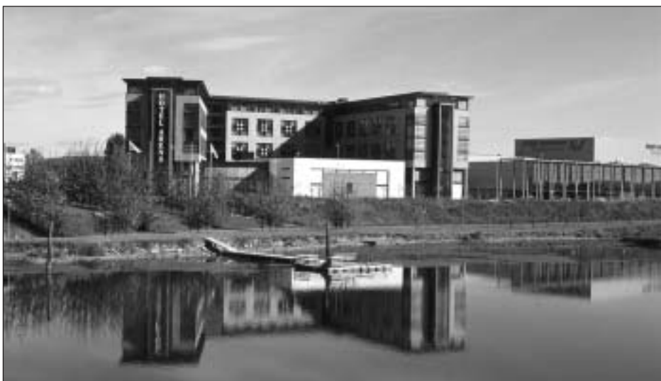
Façade de l'hôtel Arena à Lillestrøm (Norvège).

Cette relation entre les régions et les structures financières de capital permet de croire que la connaissance stratégique des facteurs de risque derrière chaque modèle d'investissement pourrait faciliter l'atteinte des objectifs d'internationalisation des chaînes hôtelières. De ce fait, les chaînes hôtelières internationales influencent considérablement le développement hôtelier dans les pays en développement. Pine et Go (1993)