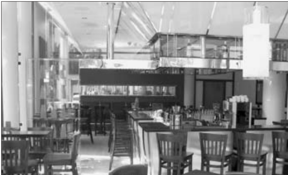
Bar de l'hôtel Arena à Lillestrøm (Norvège).

ont, pendant plusieurs années, observé le phénomène et ils expliquent que le rôle des chaînes hôtelières internationales n'est pas nécessairement celui de pourvoyeur de fonds, puisque ces derniers proviennent souvent de partenaires locaux, privés ou publics. Les chaînes hôtelières internationales apportent plutôt leur expertise dans la planification, le développement et la gestion des projets de développement hôtelier. Dans les pays en développement, on peut ajouter à ces propos que le niveau de risque associé à l'investissement en capital décourage les chaînes hôtelières internationales à s'exposer au risque d'investir des fonds. Par contre, elles y voient une occasion d'investir dans le projet en contribuant par leur expertise et activent la croissance de leur chaîne tout en se maintenant à des niveaux de risque plus raisonnables.