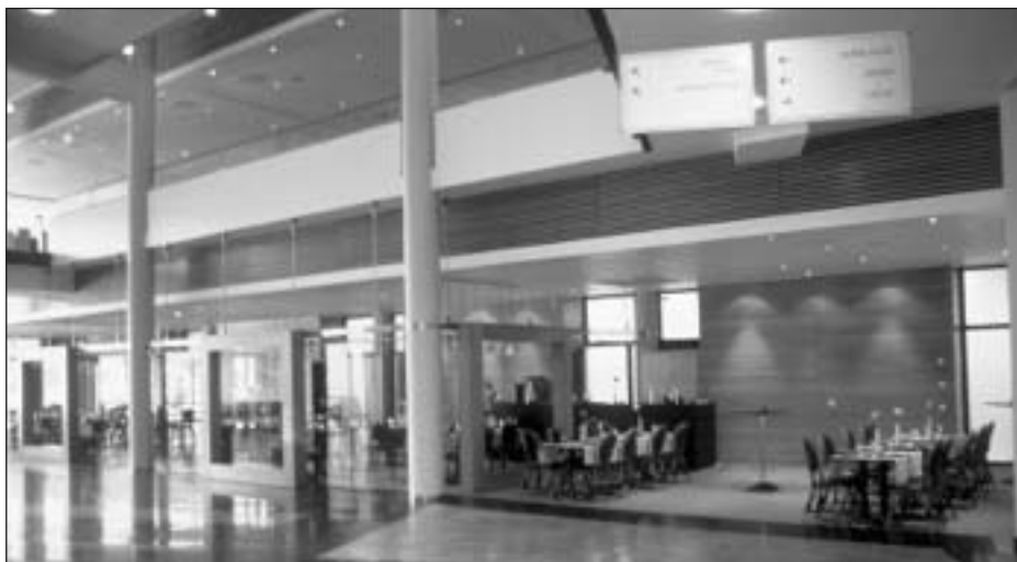
Hall de l'hôtel Arena à Lillestrøm (Norvège).

Un projet, quel qu'il soit, comporte normalement des risques. Il peut s'agir d'un projet personnel, comme la planification d'un voyage, ou bien d'un projet corporatif, telle une transaction de plusieurs millions de dollars. À plus grande échelle, un projet est un « système dynamique et complexe » (Jaafari, 2001 : 93) qui comporte la notion de changement et d'incer-