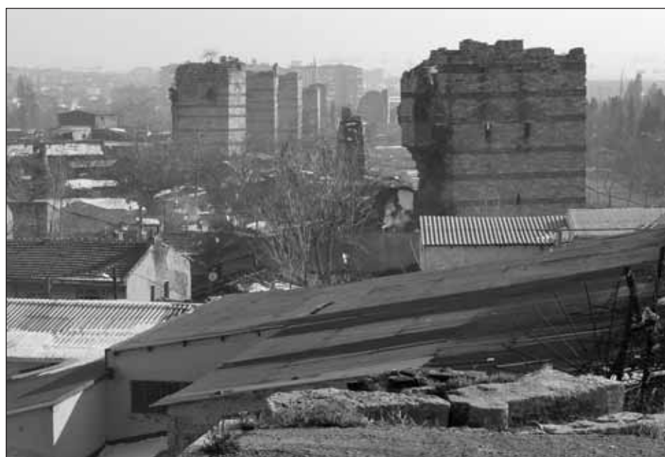
La muraille Théodose II et l'environnement urbain (Turquie).