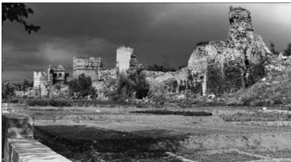
Les tours et le jardin à l'extérieur de la muraille Théodose II (Turquie).

Les visiteurs plus curieux, ou qui disposent de plus de temps, s'approchent pourtant parfois très près de la muraille de Théodose II : la Kariye, ancienne basilique Saint-Sauveur-in-Chora, petit édifice remarquable dont les mosaïques rivalisent avec Sainte-Sophie, n'est située qu'à quelques centaines de mètres d'Edirnekapi et du Tekfur Saray. Ceux qui prennent le temps d'arpenter la Corne d'Or vers Eyüp, en quête du site du pèlerinage voué au compagnon du prophète ou du café Pierre Loti, juché sur le promontoire surplombant l'ancien et immense cimetière musulman arboré, ne font que rarement le détour par le donjon d'Anemas, pourtant tout proche et bien visible. Les plus audacieux, qui iront, à l'opposé, manger du poisson sur les rives de la mer de Marmara et se promener sur les espaces aménagés entre la route et l'eau, pourraient être guidés par les derniers vestiges du rempart maritime pour atteindre les premières tours de la partie terrestre, mais cela s'avère encore plus rare sur cette portion.