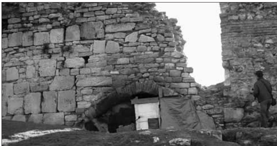
Un abri de fortune à l'intérieur de la muraille Théodose II (Turquie).

Le risque le plus fréquemment invoqué reste toutefois l'agression – le plus souvent humaine ou par les bandes de chiens errants. Quels que soient les jugements moraux portés sur les usages de la muraille, toute présence sur un espace comporte une part d'appropriation, même labile. Les réactions hostiles peuvent alors être vues, dans certains cas, comme des défenses de territoire. Concrètement, certains usages présents sur la muraille, illégaux ou non tolérés par les habitants des quartiers voisins, viennent précisément y chercher l'invisibilité. Une arrivée impromptue sur les lieux peut facilement déclencher une réaction agressive ; c'est le cas des petits trafics ou des rencontres secrètes. Quelques incidents peuvent également survenir avec les personnes ivres. L'accueil, d'abord cha-