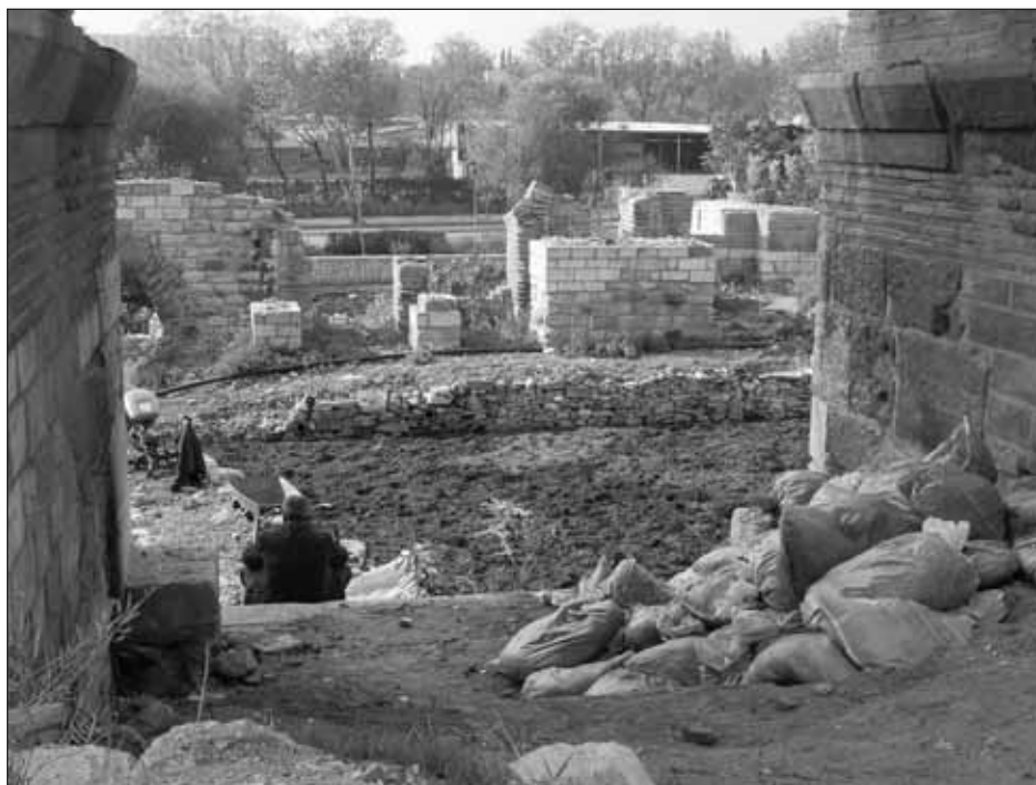
Le manque de muséification de la muraille Théodose II (Turquie).

Paradoxalement, en risquant de briser les liens avec l'UNESCO, la municipalité semble développer un projet de mise en valeur assez proche des canons internationaux du « patrimoine » : accessibilité sécurisée par