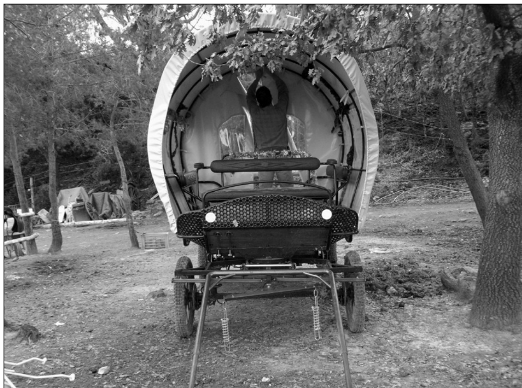
ILLUSTRATION 2 : Calèche adaptée aux fauteuils roulants.

durabilité génériques. Ces derniers sont ensuite déclinés en 65 critères opératoires dans la grille d'évaluation, une moitié portant sur des questions environnementales et l'autre moitié, sur des aspects économiques et socioculturels.