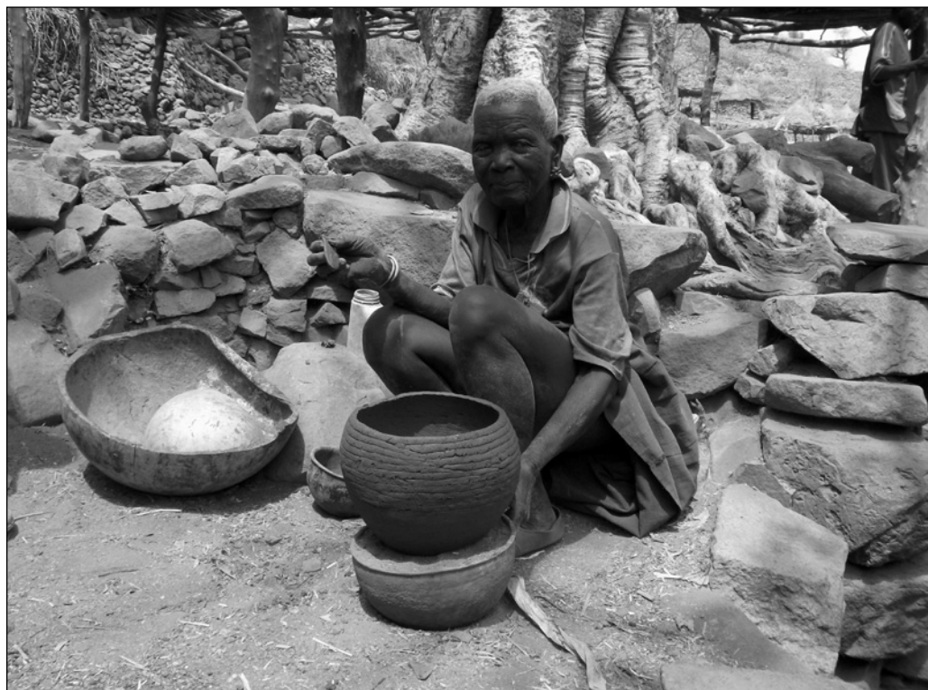
ILLUSTRATION 2 : Une potière rencontrée à Rhoumzou.

structures d'hébergement et de restauration voient aussi le jour, tout comme le campement de Mokolo en 1972, le centre artisanal de Djinglia en 1982, les restaurants La Casserole en 1987, le Petit Paris en 1992, etc. (Zra, 1993; Ahmadou, 1997). Il ressort donc que, en introduisant une rupture avec le quotidien des touristes, le patrimoine des monts Mandara a contribué à sa touristification. Cependant, la compétition que se livrent les populations pour attirer un flux important des touristes dans leurs localités respectives induit des mises en scène de la culture pour la rendre davantage séduisante et conforme aux discours sur l'authenticité.