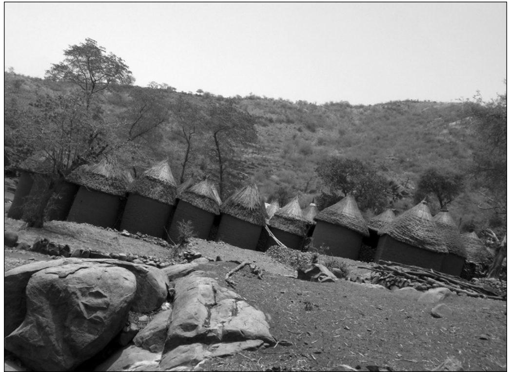
ILLUSTRATION 1 : Vue d'une concession mouktélé dans les monts Mandara (photo : Melchisedek Chétima).

l'organisation intérieure des concessions sont une matérialisation de la hiérarchie sociale entre l'homme et la femme. La partie haute de la maison s'oppose à sa partie basse comme le masculin s'oppose au féminin. L'architecture montagnarde conditionne en outre le rapport de ses occupants avec le monde extérieur. Pour l'homme, la maison représente un lieu qu'il quitte pour affronter les dangers du monde extérieur alors que pour la femme elle est un lieu dans lequel celle-ci demeure en permanence. Cette idée rejoint étrangement l'analyse faite par Pierre Bourdieu (1970) de la maison kabyle. Ces caractéristiques confèrent à l'architecture un potentiel touristique, et la visite de l'intérieur des concessions est une étape importante de l'itinéraire touristique des monts Mandara (voir illustration 1).