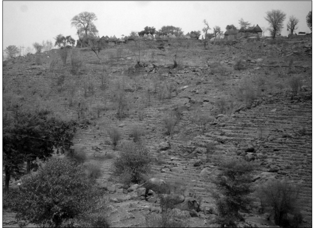
ILLUSTRATION 4 : Aperçu d'une montagne aménagée en terrasse.