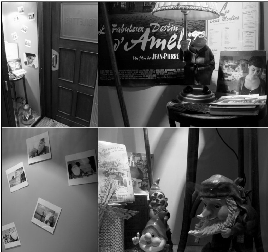
ILLUSTRATION 4 : Vues de la vitrine du café des 2 Moulins (photos et montage : Michaël Bourgatte).

la série (Lynch et Frost, 1990) qui l'ont mis en scène. Il choisit ainsi de construire avec ces œuvres de fiction un rapport de l'ordre du symbolique.