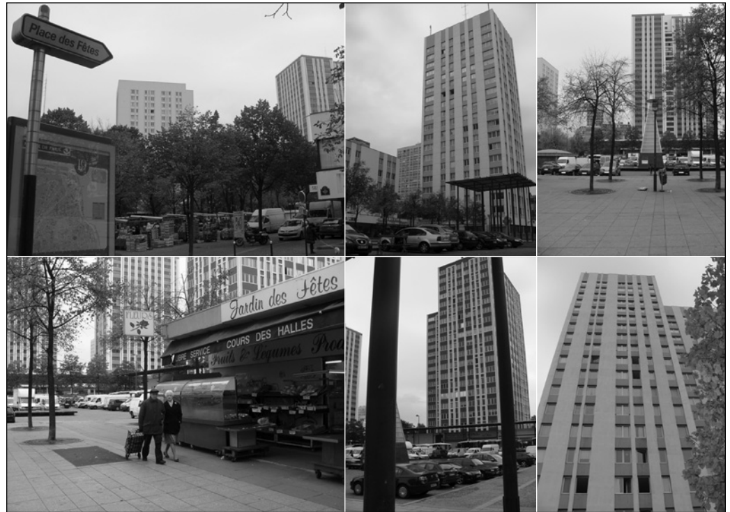
ILLUSTRATION 1 : Vues de la Place des Fêtes.

compose de cinq pages. La première page de couverture donne à voir l'affiche du film et les logos institutionnels de la mairie de Paris ainsi que le slogan « Découvrez les lieux de tournage. Discover where the film was shot ». La deuxième page du document expose le projet global des parcours cinéma puis présente le film succinctement : « Raconter en cinq minutes l'histoire d'une rencontre amoureuse dans un quartier de Paris, tel est le défi qu'ont accepté de relever, avec Paris, je t'aime , vingt et un réalisateurs venus du monde entier » (mairie de Paris, 2010 : 2). La troisième page s'organise autour d'un schéma réduit de Paris segmenté en arrondissements. Sur ce plan sont distribués les points de localisation des lieux de tournage des différents courts métrages composant le film. Six d'entre eux font enfin l'objet d'une attention spécifique en pages 4 et 5. Il s'agit de la Place des fêtes, du Faubourg Saint-Denis, de Bastille, de la Place des Victoires, du Quais de Seine et du 14 e arrondissement (à ce propos, on remarquera que c'est la diversité des types de lieux représentés qui a été privilégiée : il peut s'agir d'une place, d'un quartier, voire d'un arrondissement).