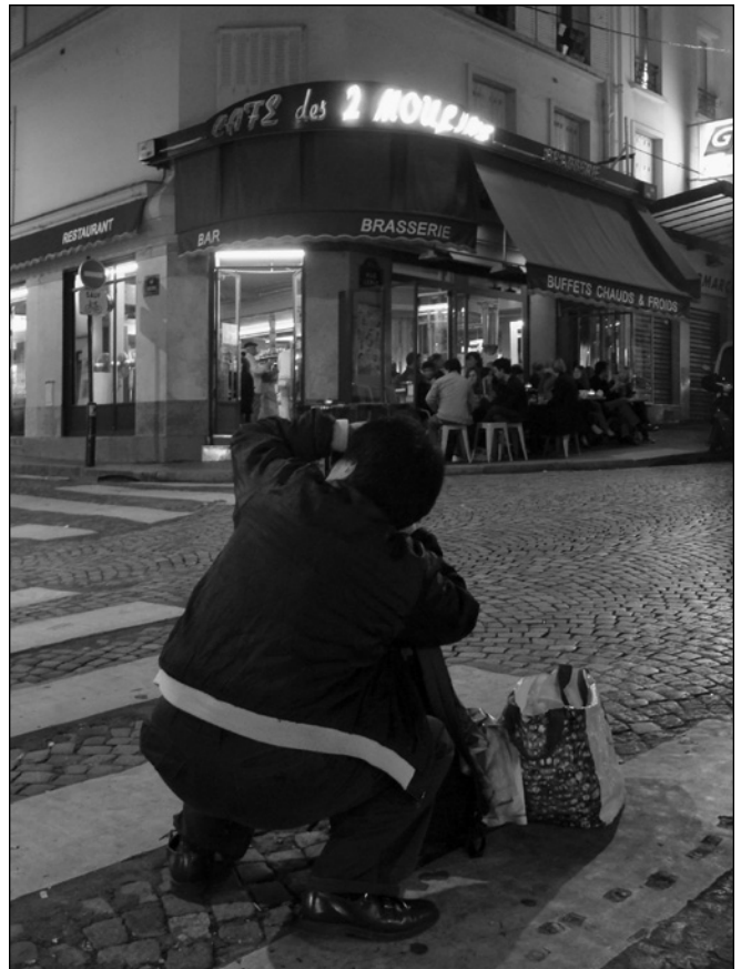
ILLUSTRATION 3 : Un touriste en train de photographier la devanture du café des 2 Moulins.

Dans la vitrine des toilettes du café des 2 Moulins, les polaroids du nain de jardin et la lampe de chevet de Collignon construisent un rapport indiciel au film. Ils semblent en avoir été arrachés pour se voir exposés. On pourra rétorquer qu'ils sont possiblement faux. Quand bien même ce serait le cas, ces copies seraient à ce point conformes aux originaux qu'elles n'en cesseraient pas moins de se donner comme appartenant à l'univers du film. Les nains de jardin définissent, quant à eux, un rapport iconique au film. Leur morphologie n'est pas celle du héros voyageur farceur qu'on y rencontre. Aucun d'entre eux n'a donc pu être arraché au film. Toutefois, la dynamique de coprésence de plusieurs de ces petits êtres permet d'instituer une relation de ressemblance ou d'analogie avec le nain