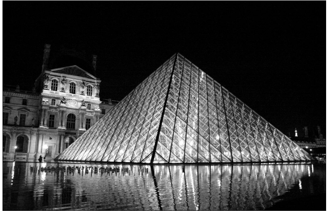
ILLUSTRATION 1 :

Le Louvre et ses mystères, cadre principal de l'action de The Da Vinci Code.