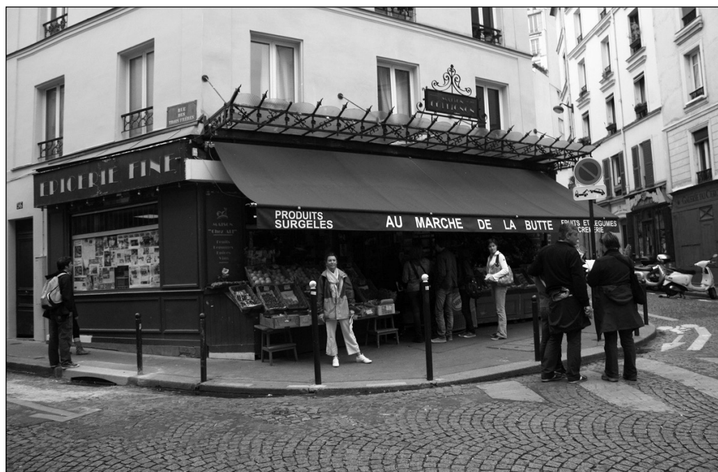
ILLUSTRATION 3 : Au marché de la Butte à Montmartre, qui devient l'épicerie Colignon dans Le fabuleux destin d'Amélie Poulain.

même entreprise (Disney ou Universal) qui s'appuie sur une expérience ludique ; d'autre part, elle n'a plus besoin du lieu comme médiateur et peut reproduire le même programme dans tous les parcs. La relation est plus complexe quand il s'agit d'un territoire ouvert.