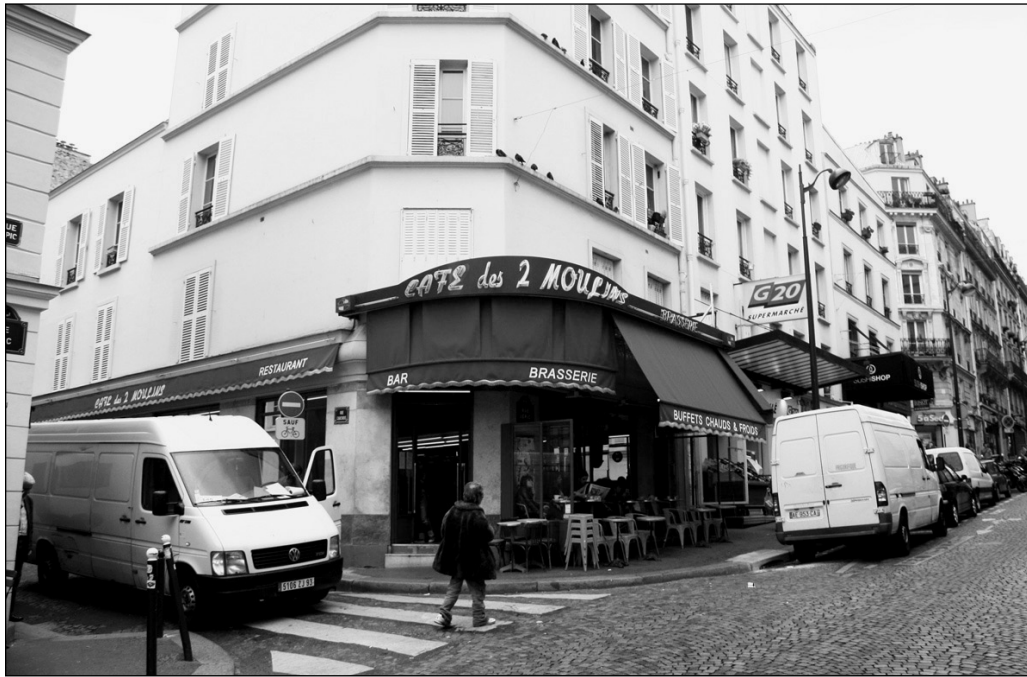
ILLUSTRATION 2 : Le café des 2 Moulins à Montmartre, où travaille Amélie Poulain.

l'impression de connaître cette ville. Beaucoup ont pu s'en forger une image, voire une carte mentale, par l'addition des références apprises au hasard des livres, des images, des reportages et des films. D'autres lieux, emblématiques, possèdent une même charge affective, qu'ils soient fréquentés ou non : la montagne marseillaise, la cathédrale de Rouen et la plage de Deauville, pour n'en citer que quelques-uns.