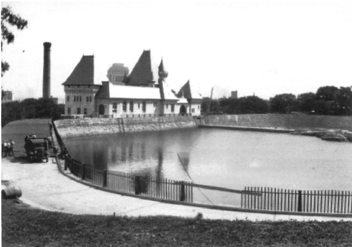
Figure 3 : Le réservoir McTavish, mis en activité à partir de 1932, de l'aqueduc de Montréal

et ils ont recours à l'histoire culturelle, économique et sociale. Par conséquent, les historiens canadiens parviennent à intégrer et à croiser plusieurs thèmes dans leurs analyses : le cadre bâti, les rapports entre les sexes, les pratiques culturelles, la gestion locale. Les catégories d'analyse comme l'appartenance à une classe sociale, à un genre et à un groupe ethnique s'avèrent des plus utilisées.