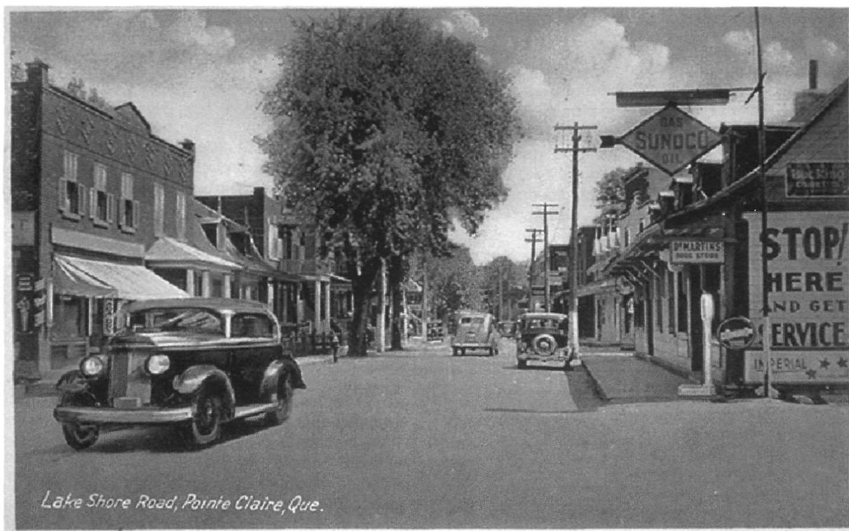
Figure 1 : Chemin Lakeshore à Pointe-Claire en banlieue de Montréal dans les années 1950

En bref, les travaux sur la banlieue – définie comme une unité administrative distincte de la ville-centre et dont les modes d'aménagement de l'espace s'en différencient – et les banlieusards ont mis en lumière un processus multiforme 28 , pluriel, éloigné de la vision stéréotypée qui en est largement véhiculée dans la culture populaire, c'est-à-dire un milieu de vie peu dense, habité par des ménages de la classe moyenne et parsemé de pavillons entourés de pelouse. Au même titre que l'urbanisation, le processus de suburbanisation est désormais considéré par plusieurs historiens comme un objet d'étude porteur d'une valeur heuristique quant à notre compréhension générale de l'histoire du phénomène urbain canadien. Par ailleurs, l'exode banlieusard qui s'amorce à partir des années 1950 a, somme toute, peu intéressé les historiens 29 . Les modalités de mise en forme socioculturelle et