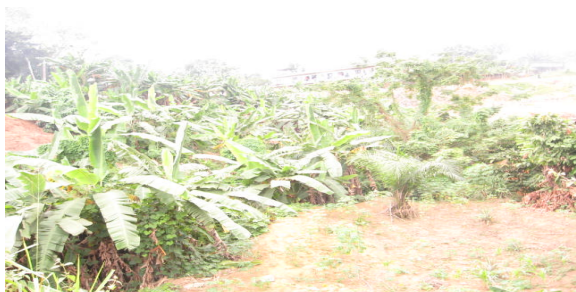
Figure 6. Champ de bananiers dans un bas-fond à Cocody près du Lycée technique (Olahan, 2009)

toutes sortes de terrains (terrains à bâtir non aménagés, terrains publics inexploités et laissés vacants, terrains d'habitation, terrains physiquement non aménageables (Mougeot, 1995). Ce dernier type de terrains, qui n'intéresse pas l'autorité compétente en la matière, fait, cependant, l'objet d'occupation en matière d'agriculture urbaine par les acteurs, malgré les risques potentiels et avérés qu'ils encourent (figure 6). Car, celle-ci (l'agriculture urbaine) ne fait pas obstacle à un aménagement plus approprié du territoire urbain, mais permet au contraire d'exploiter des endroits petits, inaccessibles, non viabilisés, dangereux ou inoccupés (Mougeot, 2006). L'espace, ici, est dévolu le plus souvent à la culture des vivriers (banane plantain, manioc, maïs,...) et des maraîchers comme les feuilles de laitue (salade), les carottes et le chou. De même, du fait que le planificateur ne s'intéresse pas à ce type de terrain dans le tissu urbain, celui-ci connaît une certaine stabilité ou de perpétuité dans son exploitation.