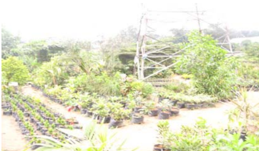
Figure 4. Plantes décoratives sous ligne haute tension à Cocody