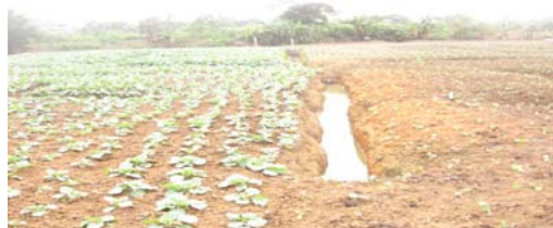
Figure 7. Eau d'arrosage dans une unité de production à côté de l'école SOS d'Abobo.