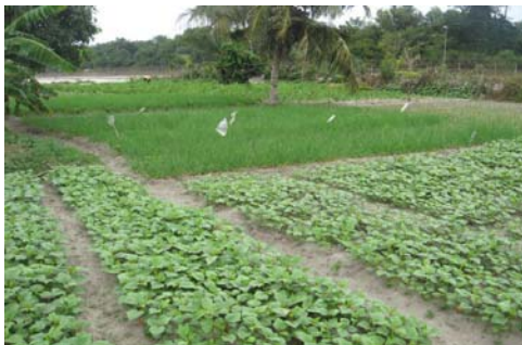
Figure 3. Maraîchers près de l'aéroport Abidjan

Ainsi, espèrent-ils attirer la clientèle et engranger des revenus. Mais, il n'y a pas que les grandes voies où l'on peut observer des unités de production agricole en milieu urbain ; on en trouve aussi à l'intérieur des quartiers.