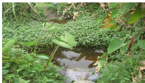
Figure 8. Puits à fleur du sol sur la voie de l'aéroport

Par ailleurs, il nous a été donné de constater par endroits, l'existence de puits à fleur de sol (cf. figure 8) sur des sites