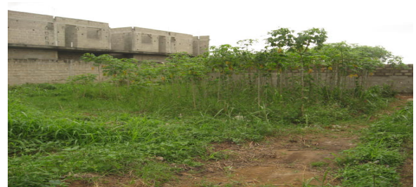
Figure 5. Champ de manioc sur un lot non mis en valeur, Cocody –Riviera (Olahan, 2009)

Par ailleurs, certains propriétaires de parcelle procèdent à des locations de leurs espaces lotis au moyen de la perception de loyer forfaitaire variant de 5000 FCFA à 10 000 FCFA par annuité. Le caractère précaire et locatif de quelques sites de production agricole incite certains acteurs à occuper des zones non constructibles malgré les risques d'inondation auxquels ils s'exposent.