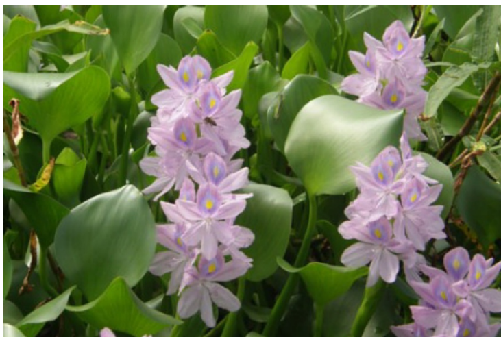
Figure 1 : La jacinthe d'eau « Eichhornia crassipes » (Pontederiaceae)