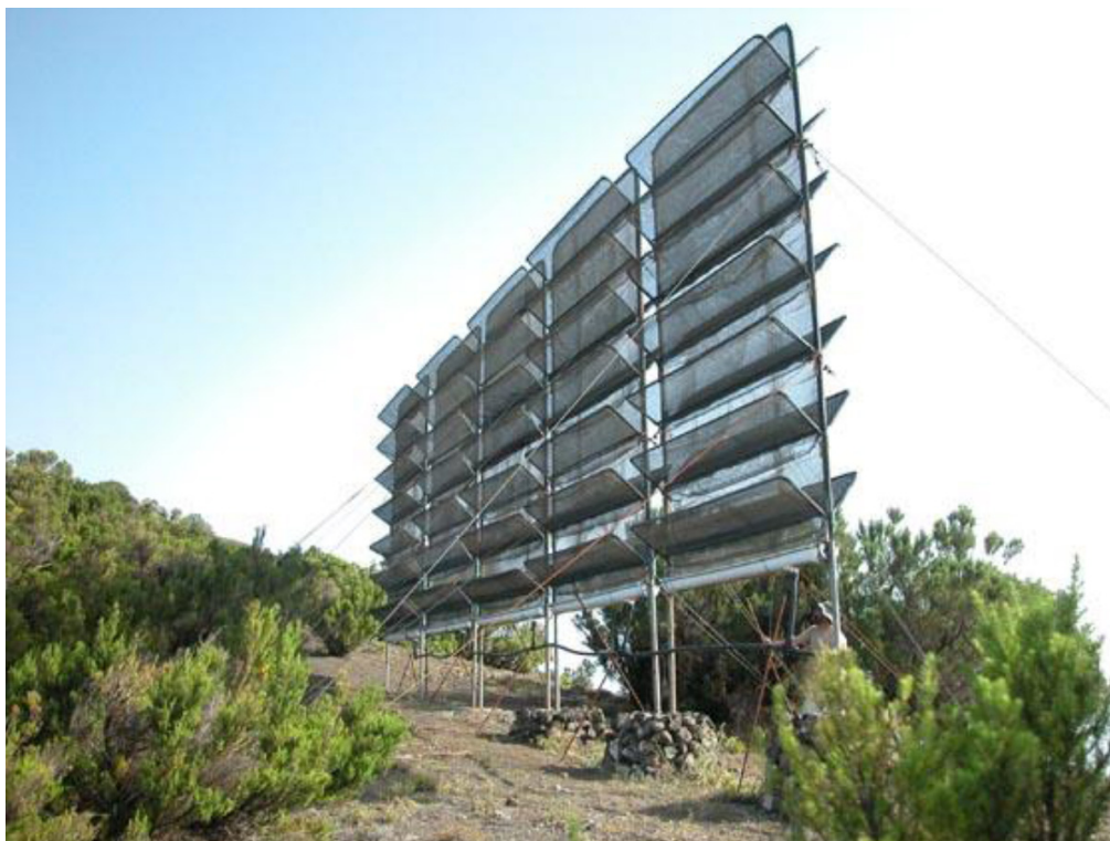
Figure 8. Des filets attrape-brouillard tels ceux installés au parc de Las Cancelitas à la fin de 2012. El Hierro, Cruz de los Humilladeros.