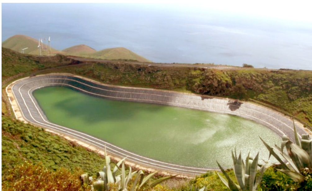
Figure 6. Le barrage supérieur de la centrale hydraulique d'El Hierro. En contrebas, les éoliennes l'alimentant en eau de mer dessalée. La Calderita, février 2014.

20 La référence au Garoé des Guanches pour la centrale hydro-éolienne permet aussi l'ancrage de la transition énergétique dans la normalité au sens de la tradition.