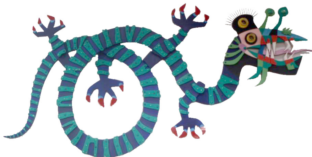
Figure 2. Le lézard géant d'El Hierro selon César Manrique. El Hierro, Mirador de la Peña, années 1980.