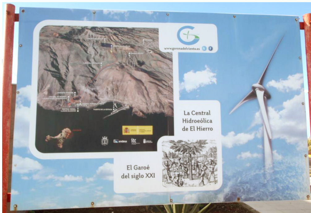
Figure 4. Le grand panneau de l'aéroport où l'ancien arbre-fontaine, le Garoé des aborigènes Guanches, est la métaphore de nouvelle centrale hydro-éolienne d'El Hierro. Février 2014.