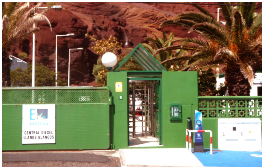
Figure 7. Le passé et le présent selon Endesa. Llanos Blancos, mars 2014.

Légende: à gauche, l'entrée de la station thermique au fioul d'El Hierro et, à droite, la borne de recharge rapide pour les véhicules électriques et leur emplacement.