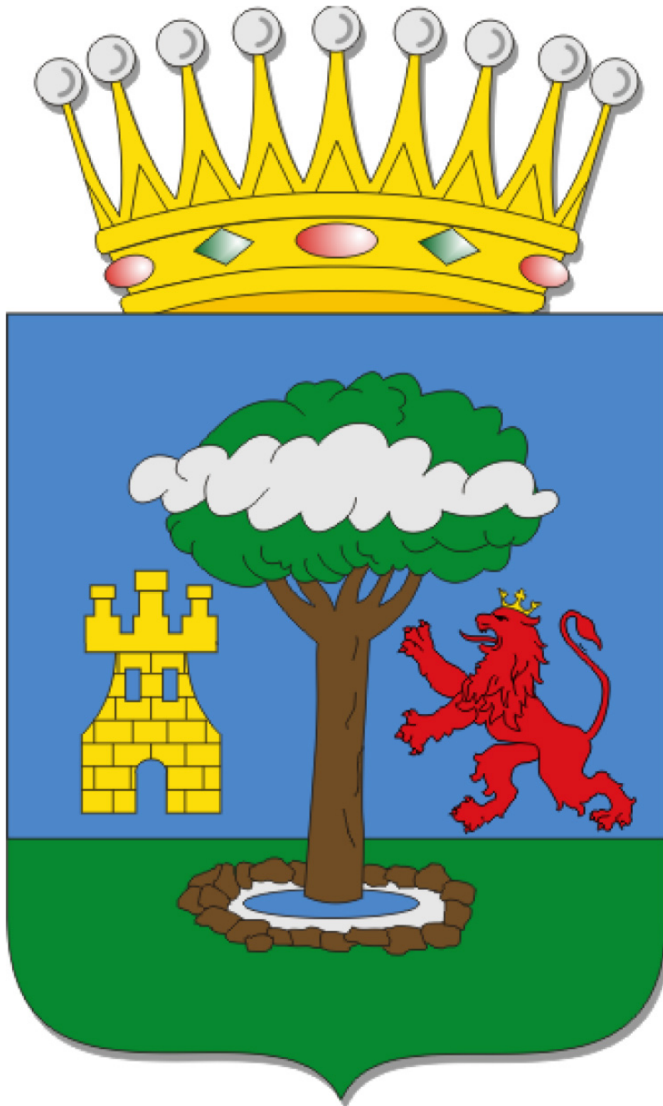
Figure 3. Les armoiries d'El Hierro avec l'arbre saint, la dénomination espagnole du Garoé, ou encore l'arbre-fontaine.