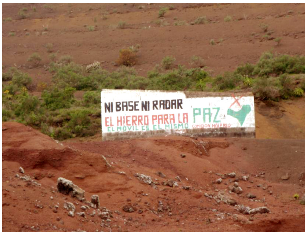
Figure 5. Des slogans antimilitaristes de ralliement, lors du refus populaire en 1997 de l'agrandissement sur El Hierro des terrains de l'armée. Ils sont bien conservés à San Andrés. El Hierro, février 2014.