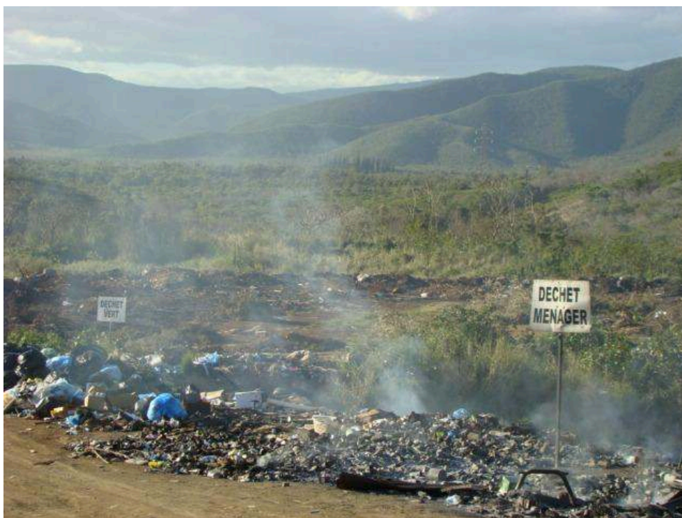
Un dépotoir en Province Nord, 2018.