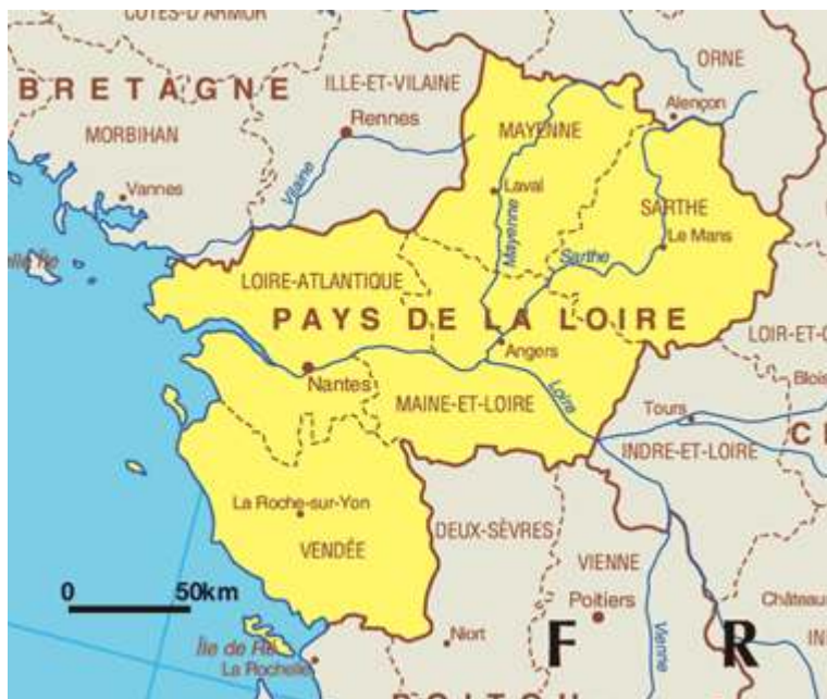
Carte 1. Région des Pays de la Loire.