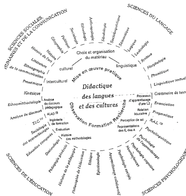
Figure 2 : Références disciplinaires prédominantes en didactique du FLE

Source : d'après Edmondson et House, 2000, utilisant un modèle de Stern