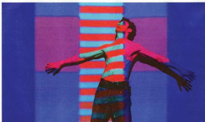
Figure 1. Le performeur devant l'écran opaque qui mime l'écran de cinéma. Il s'agit en fait d'un tulle qui permet parfois de voir l'action qui se déroule derrière, mais sa position à l'avant-scène et son encadrement par une frise le codent comme un écran de cinéma. Norman , conception et mise en scène de Michel Lemieux et Victor Poulin, 5 e salle de la Place des Arts, production 4d art, 2007.

plus contemporaine exécutée par Peter. Les deux langages chorégraphiques parviennent toutefois à cohabiter, à se répondre et à se réinventer de manière remarquable en utilisant le corps pour assurer une intégration réussie du cinéma à la scène.