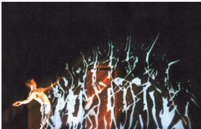
Figure 2. La ballerine surgit du corps de Peter.