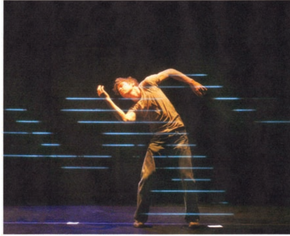
Figure 5. L'abstraction des lignes horizontales naît du mouvement initié par le danseur.