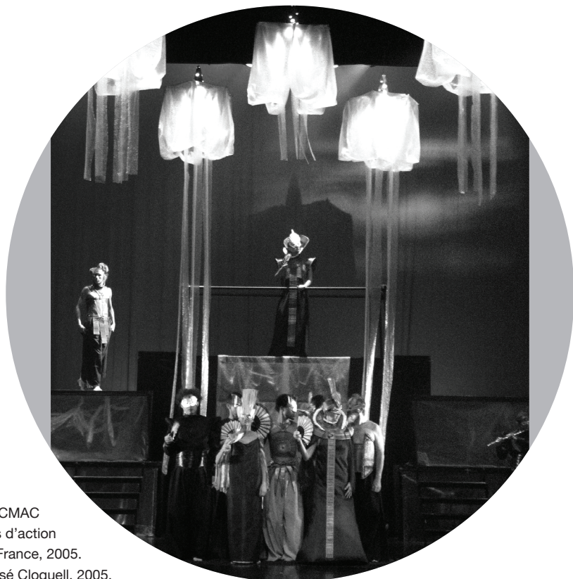
Roméo et Juliette , adaptation et mise en scène de la pièce de Shakespeare par Yoshvani Medina, scène nationale du CMAC (Centre martiniquais d'action culturelle), Fort-de-France, 2005. Photographie de José Cloquell, 2005.

de békés 10 , alors que Roméo est issu d'une couche inférieure de la société martiniquaise, celle des nègres qui, bien que libres en ce début de XX e siècle, ne jouissent pas des mêmes droits. Cette hiérarchie raciale et sociale est rendue visible dans la scénographie de Yoshvani Medina qui installe sur la scène des échafaudages sur lesquels les personnages montent et descendent suivant leur statut et leur destinée. Les costumes des comédiens appartiennent à plusieurs époques (antique avec les drapés, classique avec les collerettes, futuriste avec les matériaux et les coupes de certains costumes). Ce télescopage de différentes périodes génère une impression d'atemporalité recherchée par Yoshvani Medina qui met en scène non seulement les tensions sociales et raciales passées mais aussi celles de la société antillaise actuelle. D'origine cubaine, donc extérieur à la Martinique, mais suffisamment informé des réalités de l'île pour y