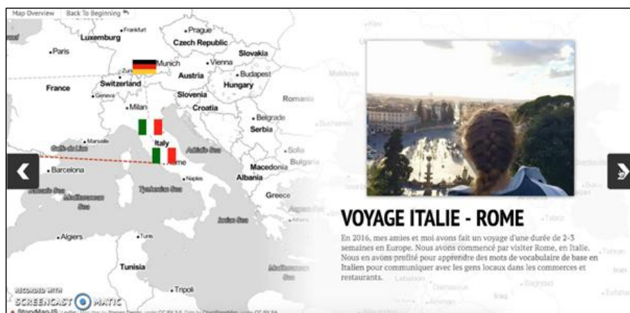
Exemple de composition d'une page de la biographie langagière faite sur StoryMap

Le deuxième élément visuel en importance dans les récits étudiés est la photo. Sa taille sur la page numérique est fixée par le gabarit de StoryMap. Dans le corpus étudié, on relève que presque toutes les épingles sont accompagnées d'une photo. Les étudiants ont en fait utilisé deux types de photos : personnelles et libres de droit ( stock ). Les photos personnelles sont des photos de soi ou qui ont été prises par l'étudiant. La photo offre une mise en contexte (par exemple, avec une photo libre de droit d'une ville) ou présente un moment dont il est question (par exemple, avec une photo d'enfance). Il y a bien sûr une dimension plus personnelle lorsque l'étudiant choisit de mettre une photo de soi en contexte, ce qui donne au lecteur l'impression d'être plus proche de l'auteur de la biographie. Il peut donc recevoir avec plus de justesse le message de l'auteur. Ces photos personnelles, ces portraits ou autoportraits, permettent d'enrichir la dimension biographique de ces cartes numériques ; elles sont contemporaines de l'événement en question en illustrant un récit sur l'école primaire avec une photo portrait officiel fait à l'école ou une photo d'eux-mêmes avec leur groupe d'amis au secondaire (cf. Figure 3).