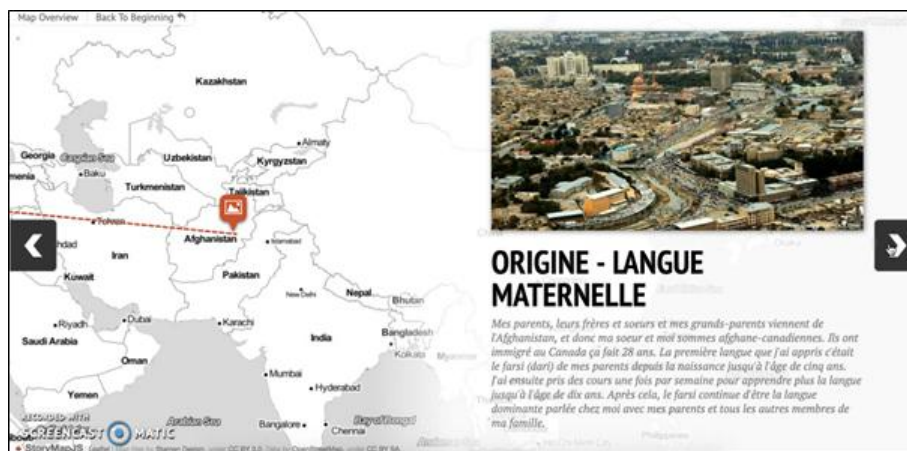
Exemple de déplacement symbolique pour rappeler les origines linguistiques