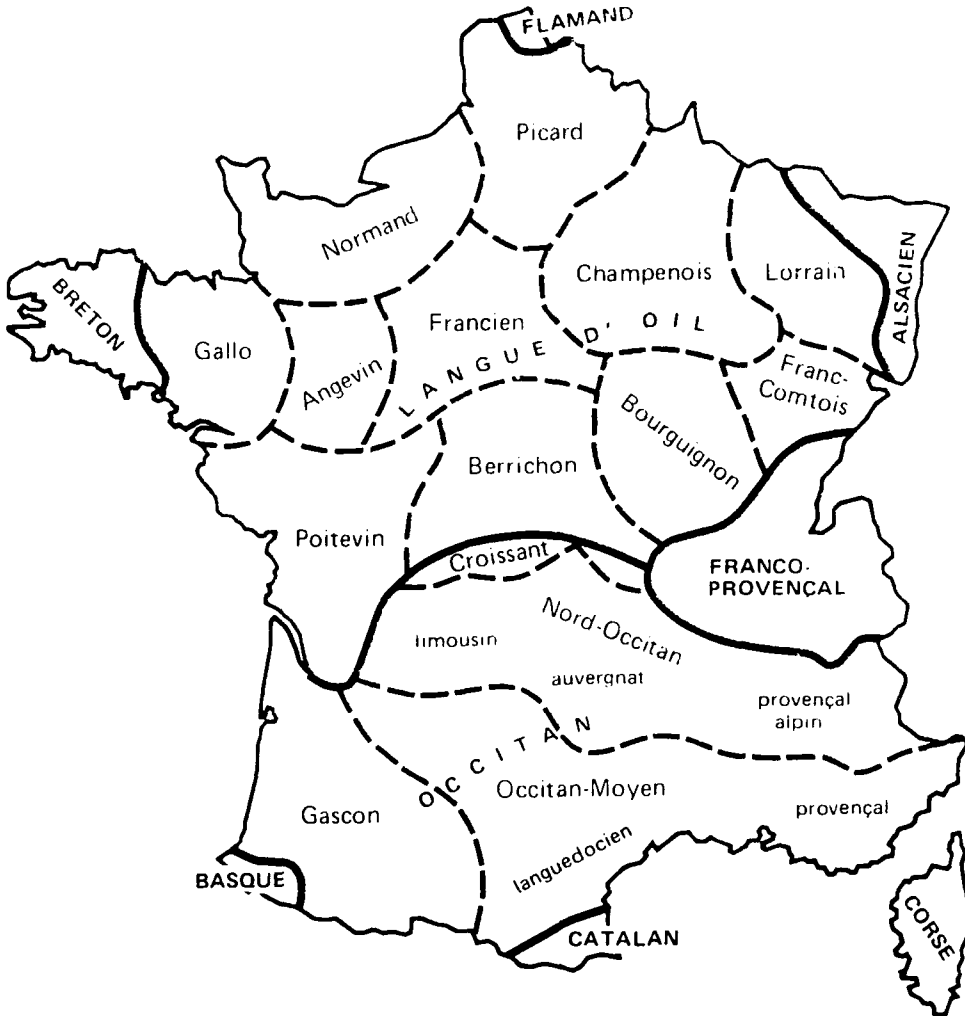
FIGURE 1 Langues et dialectes de France*