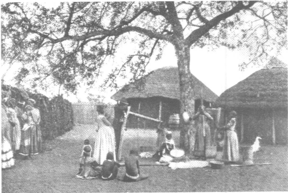
Figure 4 : « Broyer et vanner le blé ». Tiré de Willoughby, Native Life on the Transvaal Border , s.d. : 32.

Ce costume composite fut le produit d'une conjoncture spécifique : c'était un pastiche unique, fait d'éléments européens et africains, qui captait précisément la relation paradoxale de différence et de ressemblance qui finit par transformer les peuples colonisés en populations « ethniques » en série. Ce qui était caractéristique de ces styles, et en fait crucial pour leur signification historique, c'est leur « conservatisme », qui est probablement (comme le montre le cas des Tswana du sud) une caractéristique relativement récente et qui est plus que l'anachronisme marqué typique des « traditions inventées »; c'est une évocation répétée du moment même de la redéfinition radicale des identités « locales » dans des termes eurocentriques. C'est là l'essence du soi-disant « costume populaire » d'Afrique du Sud et d'ailleurs.