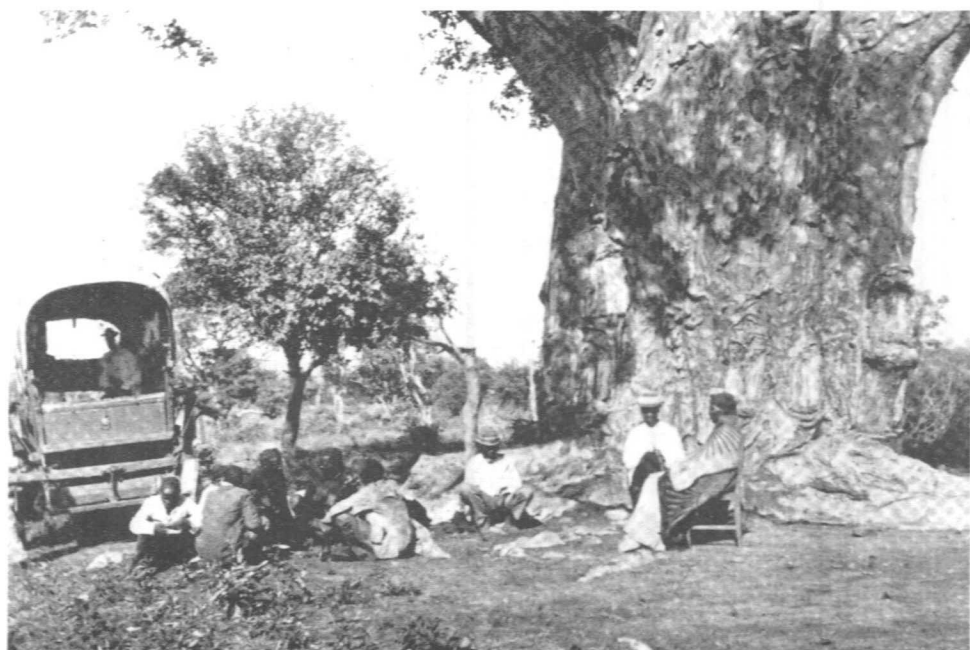
Figure 5 : « Divertir les amis sous le baobab ». Tiré de Willoughby, Native Life on the Transvaal Border , s.d. : 11.

Nous avons vu que leurs premiers contacts avec les marchandises et la consommation britanniques encouragèrent les Tswana à exhiber les objets venus de l'étranger de manière variée et créative. Mais ces objets étaient eux-mêmes insérés dans des formes de relations destinées à transformer les sociétés africaines. Les vêtements portaient en eux les fils de la macroéconomie; ils étaient des moyens prêts-à-porter d'insérer les peuples indigènes dans le marché colonial des biens et du travail. Ces processus montrent comment un manteau composé de forces politico-économiques globales en vint à reposer sur les épaules de personnes individuelles, les redéfinissant comme les porteuses d'une identité prête-à-porter.