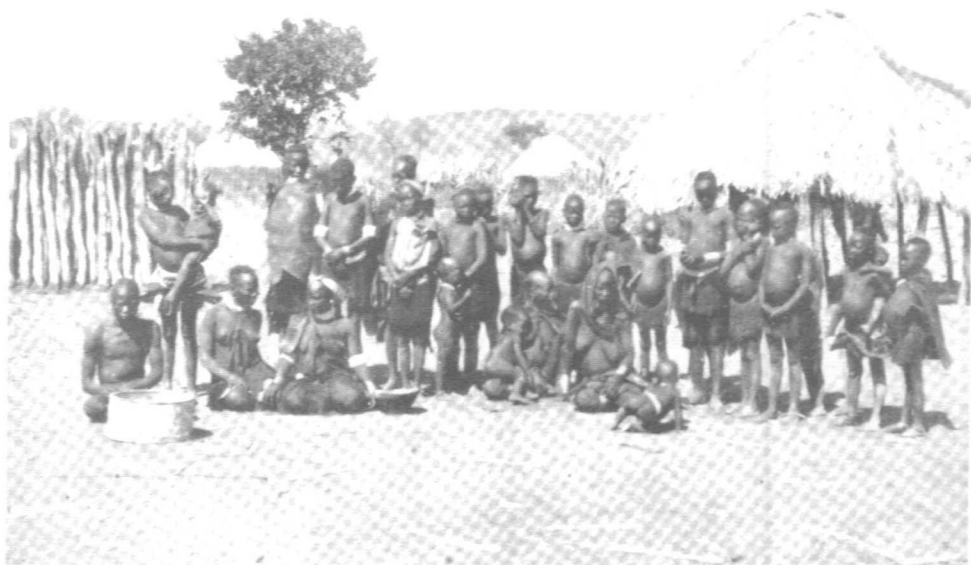
Figure 3 : « Génération montante ». Tiré de Willoughby, Native Life on the Transvaal Border , s.d. : 49.