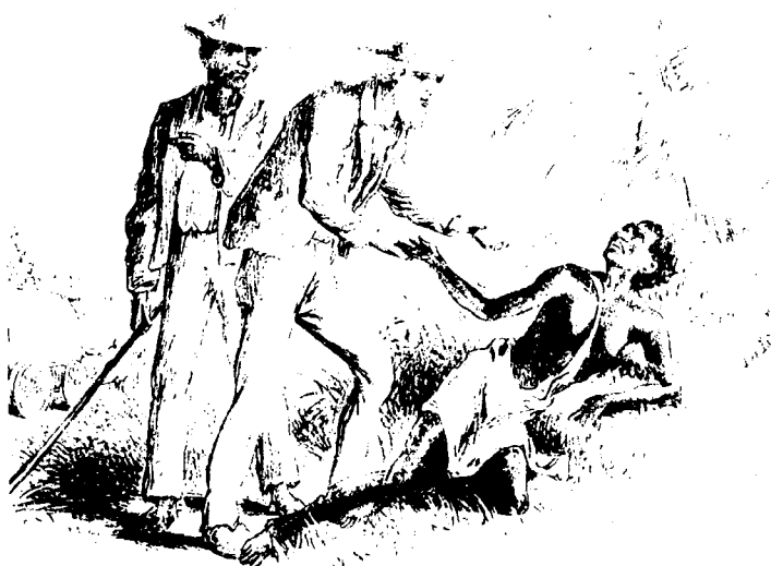
Figure 1: «La mère abandonnée: une scène dans la vie de Robert Moffat». Tiré de Adam & Company, The Life and Explorations of Dr. Livingstone , 1874 : frontispice.

Le plus dérangent pour les évangélistes était la place du vêtement dans l'ensemble de l'ordre social tswana. Comme je l'ai indiqué, le monde européen considérait les habitudes éclairées de consommation comme le principal indice de la valeur sociale