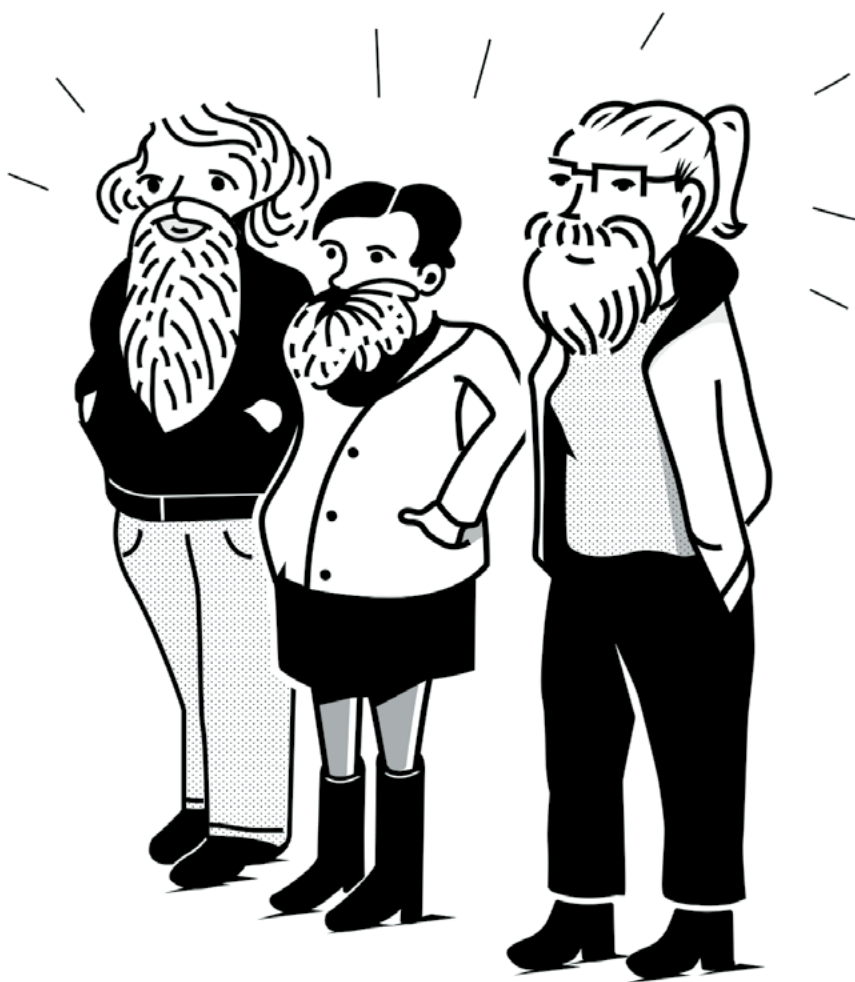
fig.34 : La barbe

d'oppression et vers la promotion de l'« autodétermination de genre et de la souveraineté de l'individu sur son propre corps » (Centre de lutte contre l'oppression des genres). À Montréal, les organisations communautaires et les centres de ressources (ASTT(e)Q, GRIS, Projet 10), les espaces d'exposition et de création, de dialogues et d'échanges (Montréal arts interculturels [MAI], article), les librairies et bibliothèques (l'Euguélonne, Mandragore), les festivals (Qouleur, Pervers/Cité), les cafés (Le Cagibi, Café Velours), les bars et salles de spectacle (Notre-Dame-des-Quilles, bar le Ritz), etc., sont autant de lieux où il est possible de définir et d'exprimer son identité, et d'expérimenter de nouveaux modes de vie et d'organisation en dehors des divers systèmes d'oppression.